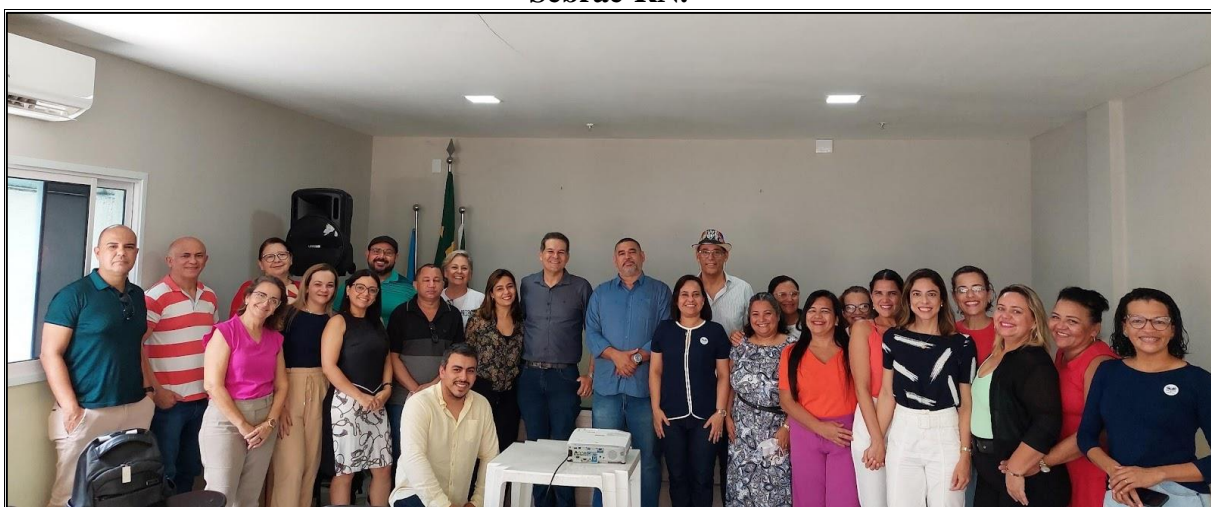
Figura 2 – Momento final da palestra sobre Planejamento Estratégico realizada pelo Sebrae-RN.

O planejamento estratégico da Copeb começou a ser construído a partir de um curso de 4 horas ofertado pelo Serviço Brasileiro de Apoio às Micro e Pequenas Empresas do Rio Grande do Norte (Sebrae-RN), no dia 03 de novembro de 2022, no plenarinho da Câmara Municipal de Parnamirim, com foco na definição do que é uma meta, diferenciando-a de atividades e ações (Figura 2).