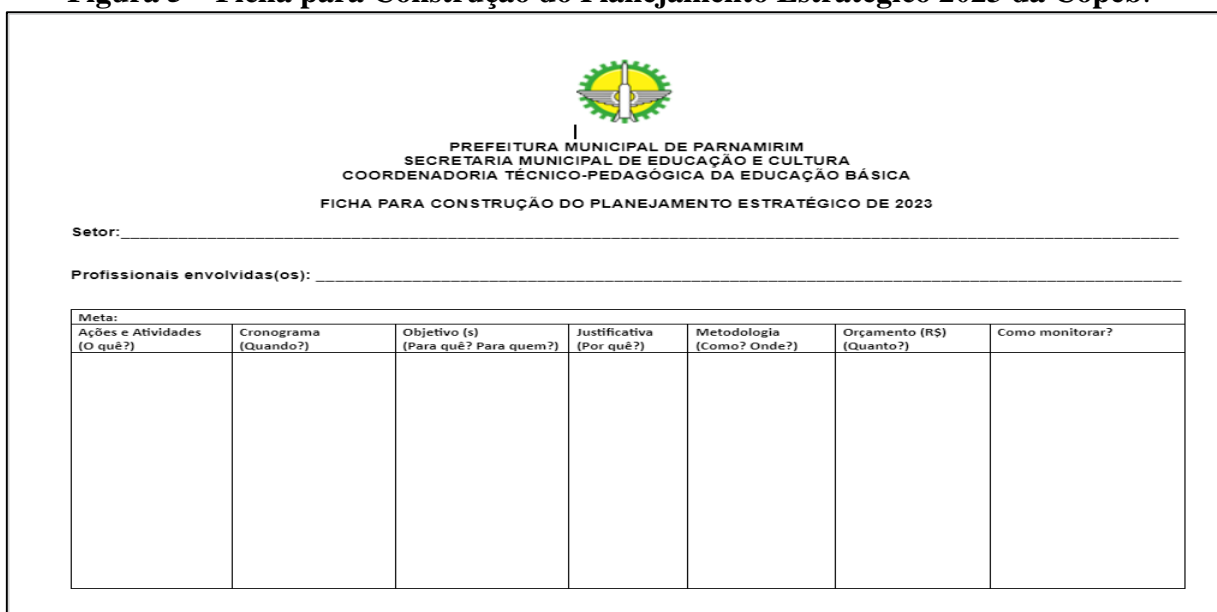
Figura 5 – Ficha para Construção do Planejamento Estratégico 2023 da Copeb.

No segundo dia, cada subgrupo preencheu a ficha de planejamento, designando as metas, as ações ou atividades (o quê?), um cronograma (quando?) e um orçamento (quanto?). Nessa ficha, cada subgrupo também teve que pensar em um objetivo (para quê?), uma justificativa (por quê?), a metodologia (como? Onde?) e quem e como monitorar (por quem?) a meta. Nesse contexto, as metas foram construídas com base na ferramenta administrativa 5W2H, que foi utilizada no planejamento estratégico da Copeb para 2022. A ferramenta 5W2H significa – What? (O quê?), Why? (Por quê? Para quê?), Where? (Onde?), When? (Quando?), Who? (Por quem? Para quem?), How? (Como?), How Much? (Quanto custa?) (Figura 5).