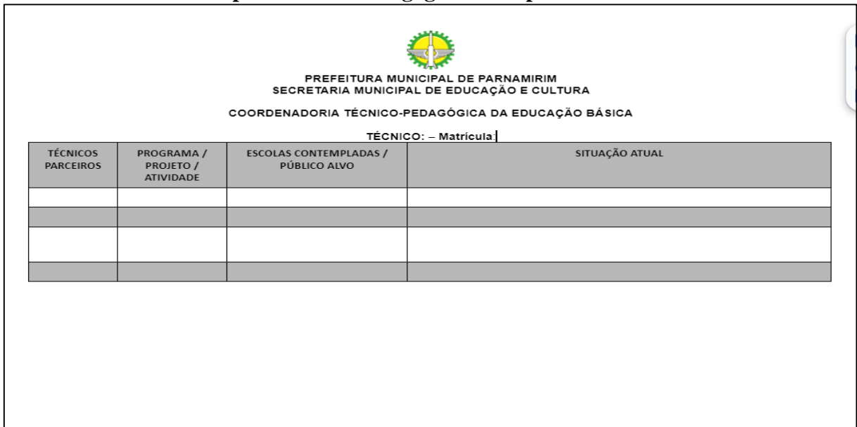
Figura 7 – Ficha de Monitoramento das Atividades e Ações do Planejamento Estratégico por Técnico-Pedagógico da Copeb-SME.