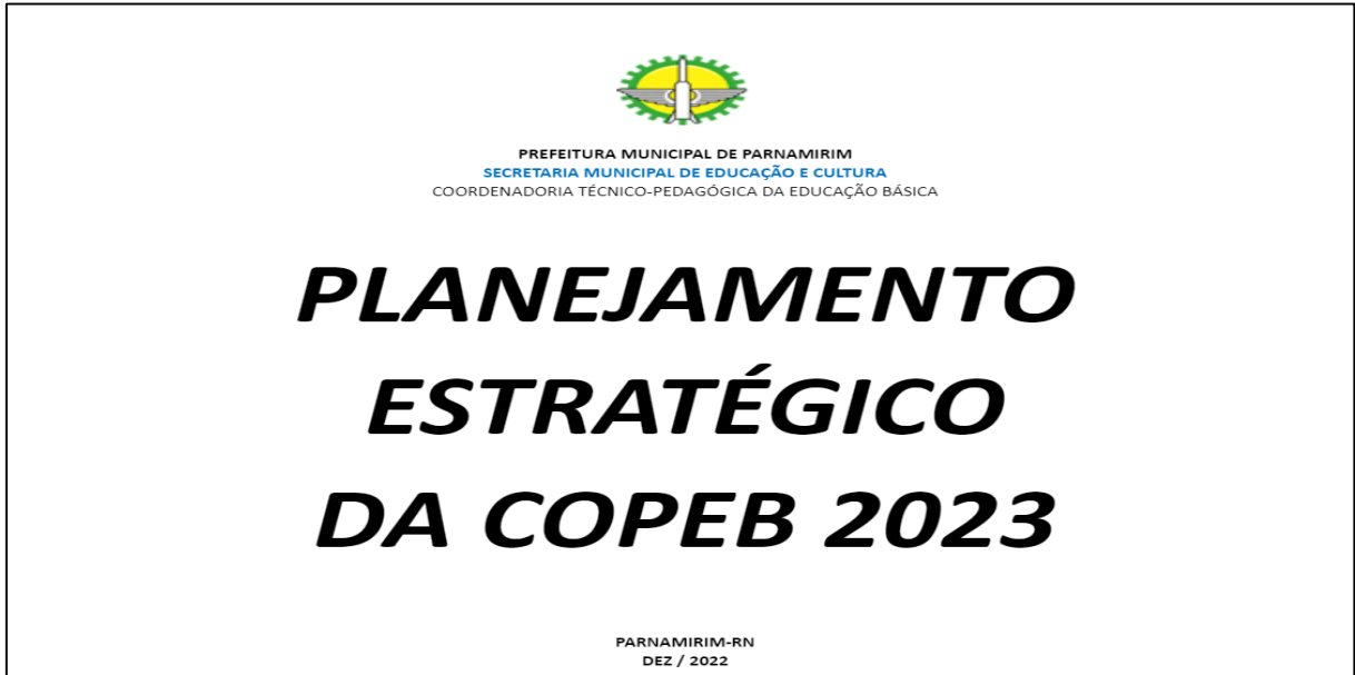
Figura 6 – Capa do Planejamento Estratégico da Copeb 2023.

Doing (Fazendo); e Done (Feita). Esse modelo foi adaptado para um documento do Google Drive, uma ficha de acompanhamento dos assessores da Copeb, no qual cada assessor preenche sua respectiva ficha, acompanhada pelo coordenador do setor (Figura 7).