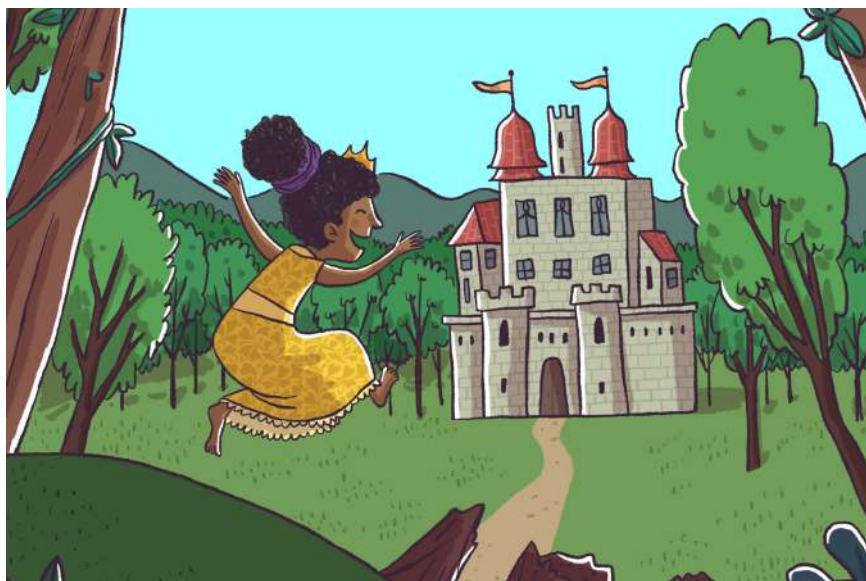
Imagem 03: Princesa Sophia correndo descalça no jardim do castelo, ilustrações do livro.

No entanto, o ponto central da narrativa da obra, talvez o principal objetivo, demonstra que existe alegria em ser livre. A princesa acaba fugindo da escola e volta a seguir as regras que ela se sentia feliz em fazer, as quais não envolviam usar salto alto e tão pouco aderir comportamentos de inferioridade sob outro gênero.