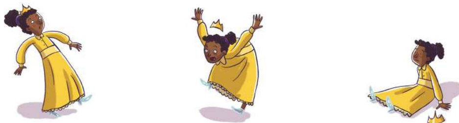
Imagem 01: Princesa Sophia, ilustrações do livro.