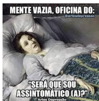
Figura 1 – Meme “Será que sou assintomático(a)?”

Esses memes tratam de maneira bem humorada sobre esse período. O meme “Será que sou assintomático(a)?” traz uma imagem de uma mulher, aparentemente doente, deitada em seu leito e com o texto escrito, na parte superior: “mente vazia, oficina do.”; e na parte inferior da imagem: “será que sou assintomático(a)?”.