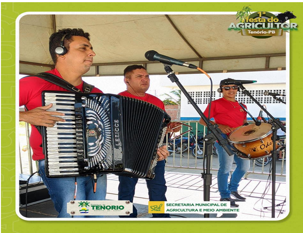
Apresentação cultural com artistas da região 1ª feira do agricultor de Tenório-PB 2021