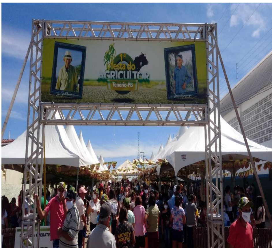
1ª Feira do Agricultor em Tenório-PB 2021

A primeira festa do agricultor de Tenório,foi realizada nos dias 30 e 31 de Julho de 2021 e contou com exposições,comercialização de produtos agropecuários,distribuição de mudas de plantas nativas,serviços de saúde entre outros serviços.A festa também contou com eventos musicais,comercialização de artesanato e comidas típicas,além de valorizar ainda mais a agricultura e fomento da economia e turismo regional,(SMAN,2021).