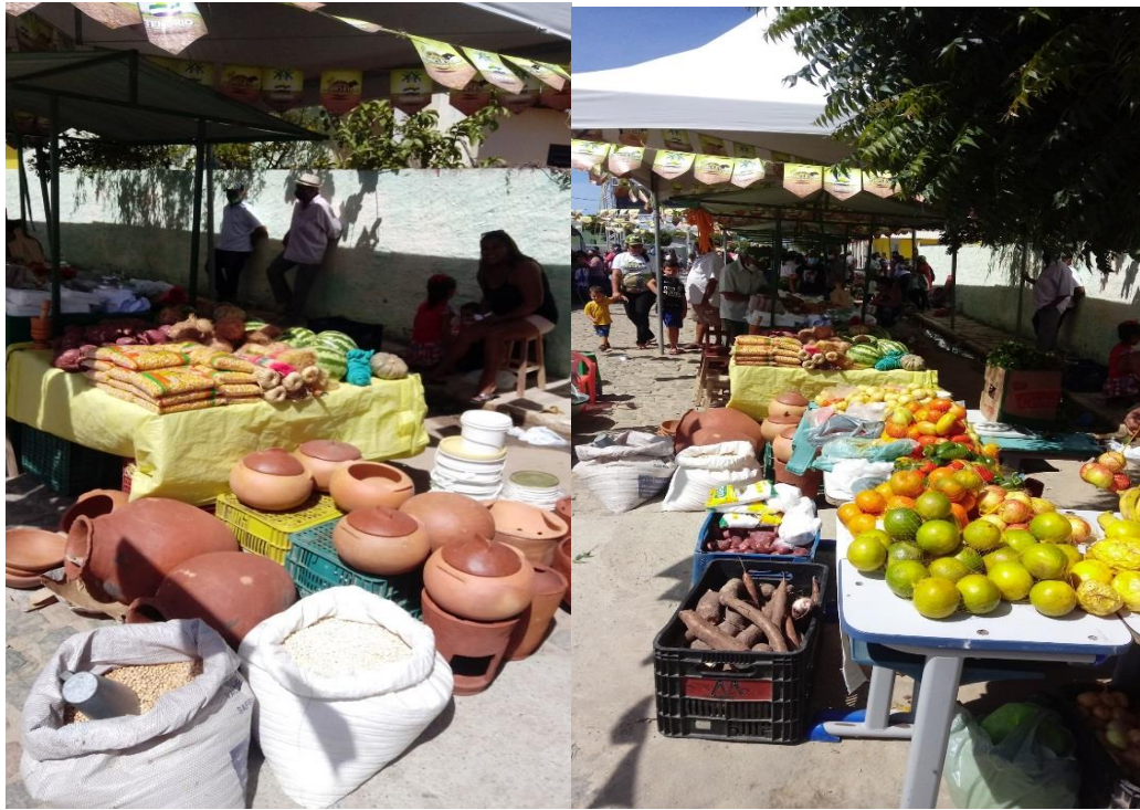
Produtos da agricultura familiar a venda 1ª feira do agricultor em Tenório