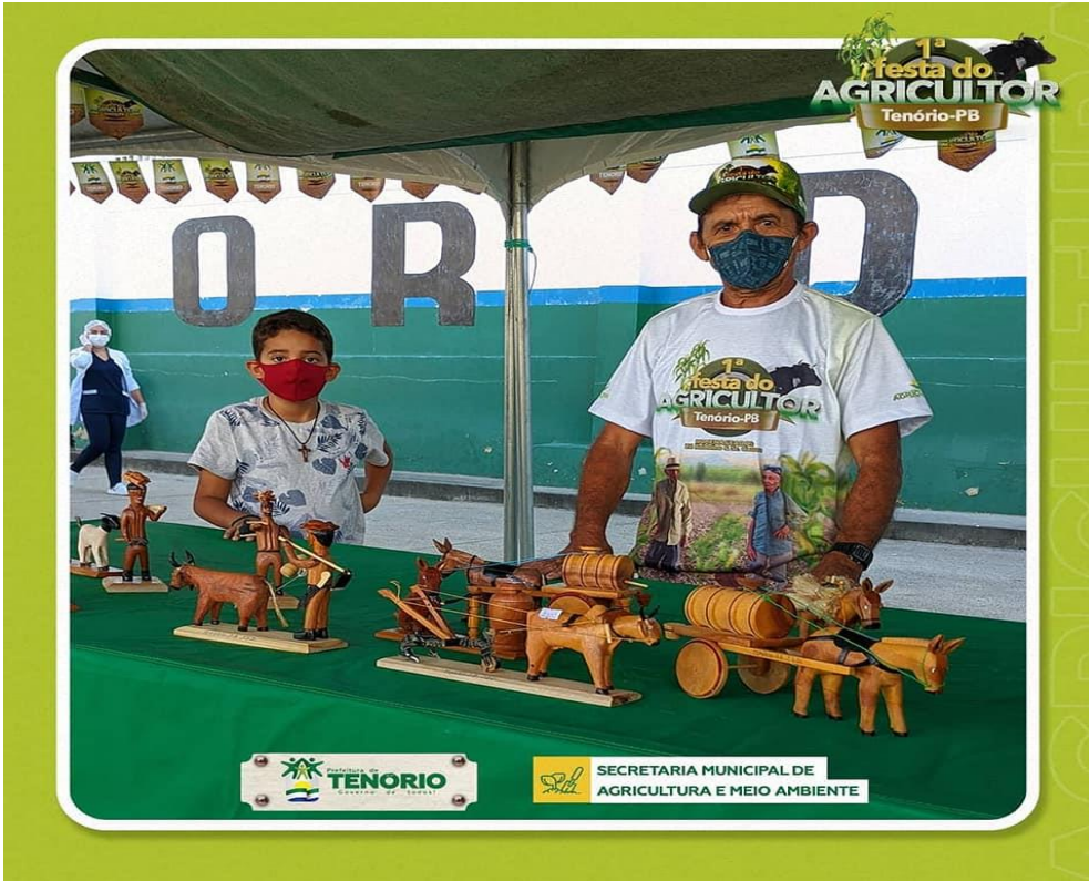
Produção de artesanato a venda na 1ª feira do agricultor de Tenório-PB 2021