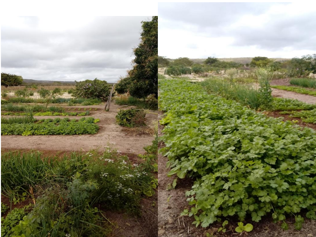
Produção de hortaliças-Sítio Barra do Riacho Tenório-PB