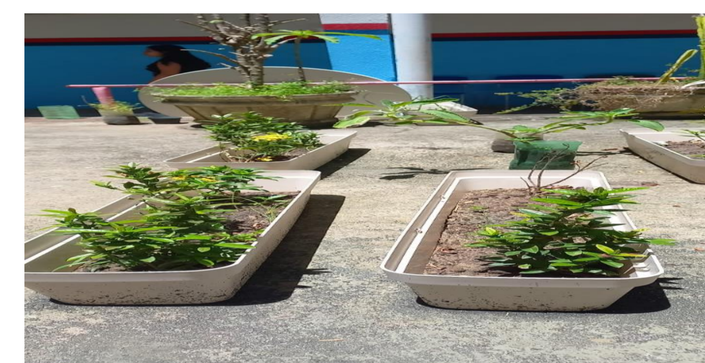
Figura 1. Produção de Mudanças.

Segundo Alves e Paiva (2010) é necessário que os projetos de jardins contemporâneos se adéquem aos diferentes sentidos humanos, sejam mais sutis e tenham como propósito a sensibilização do homem moderno para o cultivo de sua inter-relação com a natureza, gerando cenários mais criativos, dinâmicos e elaborados.