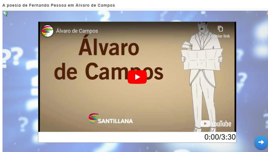
Figura 01. Quiz Literário.

A atividade planejada foi concebida para ser aplicada em turmas do 1º, 2º e 3º ano do ensino médio e técnico. Para a execução desta atividade, foi realizada a exibição de um vídeo de aproximadamente 3 minutos e 30 segundos, disponível no YouTube, que serviu como introdução ao tema abordado no Quiz Literário, localizado no sítio LearningApps.org.