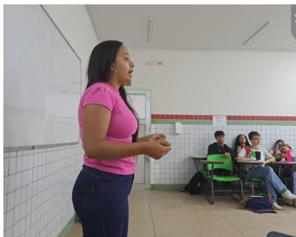
Figura 01. Explicação do Conteúdo.

Para que os alunos pudessem ter mais contato com esse gênero, primeiramente foi apresentado o tema, como pode ser observado por meio do registro fotográfico apresentado na Figura 1.