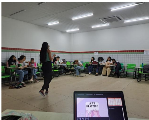
Figura 02. Compartilhamento de leitura

Após a explanação do conteúdo, foi proporcionado um momento para promover a socialização e o compartilhamento de conhecimentos entre os estudantes. A leitura compartilhada foi o ponto culminante, proporcionando uma oportunidade valiosa para os alunos aplicarem os adjetivos comparativos de maneira prática e consolidarem seu entendimento. Este momento de interação consolidou o aprendizado de forma colaborativa, enriquecendo a experiência educativa e fortalecendo a compreensão do tema. A Figura 2, representada por meio de um registro fotográfico, evidencia o momento de interação entre os alunos.