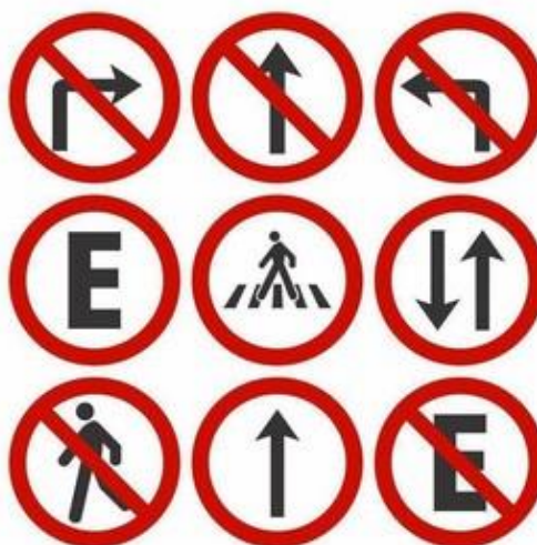
Figura 01. A imagem foi usada para ressaltar a importância da leitura não verbal no dia a dia para os alunos.