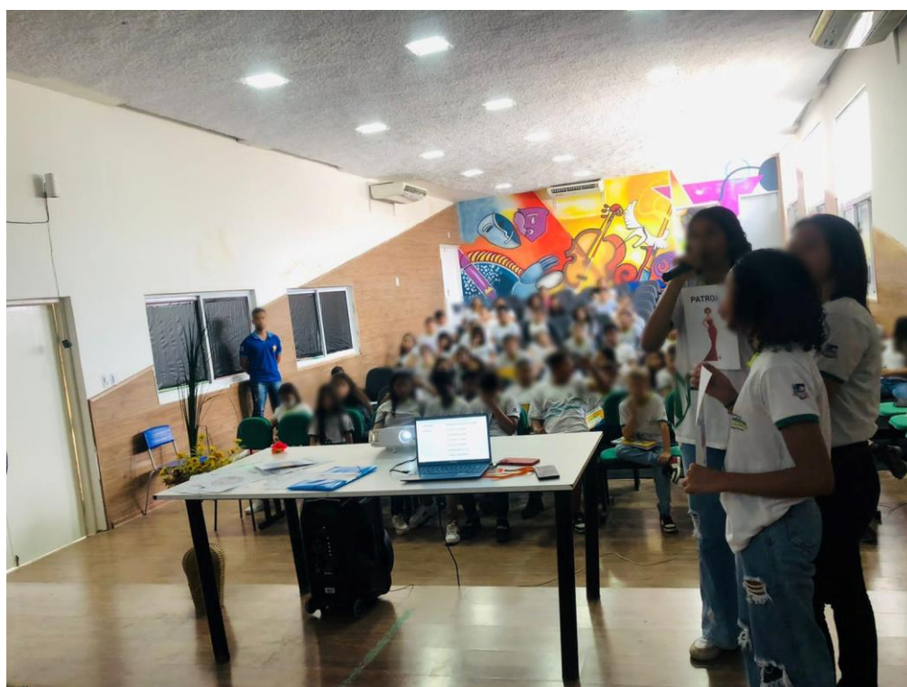
Figura 06 – Alunas dramatizando o texto durante a oficina.

No terceiro momento foi apresentado o texto dramático “Maria Roupa de Palha”, da escritora Lourdes Ramalho. A apresentação ocorreu de forma breve, apenas para os alunos familiarizarem-se com o texto e ser feita a divisão das personagens. Em seguida, foi realizada a seleção de alunos-personagens. Posteriormente, foi realizada a leitura da obra da Lourdes Ramalho. Por fim, foi aberto um momento de feedback para os alunos comentarem sobre a obra e a oficina.