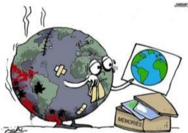
Figura 03. Imagem utilizada para ressaltar a interpretação de texto não verbal para os alunos.