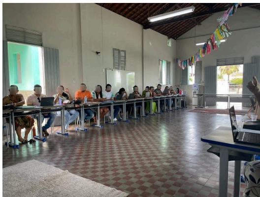
Figura 2 - Momento da oficina pedagógica

O desenrolar da oficina revelou a conjuntura tecnológica da instituição na qual a aplicamos. A referida instituição, está situada em uma área de vulnerabilidade social e econômica, por isto, apresenta uma insuficiência de aparelhagem tecnológica, uma vez que não detém sequer um espaço ou laboratório de informática. Entretanto, os professores mostraram-se dispostos a participar deste momento de formação continuada, com os seus recursos próprios ( notebooks e laptops ). Urge considerar que a escola há alguns anos foi contemplada com uma política pública que visava à distribuição de computadores portáteis para os professores.