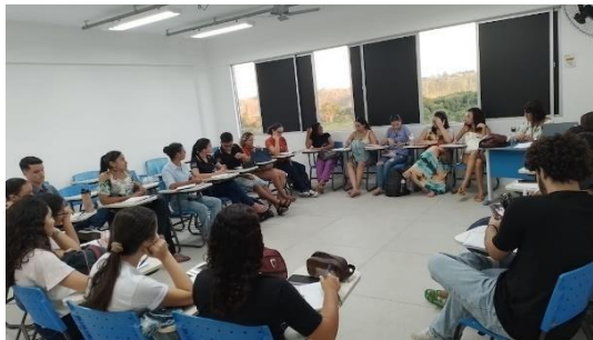
Imagem1: Grupo de estudo teórico organizado no Campus

escolar, como: encontros semanais na escola campo para planejamento e execução de atividades; encontros semanais na Universidade para orientação; organização de murais pedagógicos da escola; condução de leituras pedagógicas; construção de gêneros acadêmicos (artigos, pôsteres, relatórios, apresentações orais) e participação de eventos; organização de grupos de estudos e participação em oficinas.