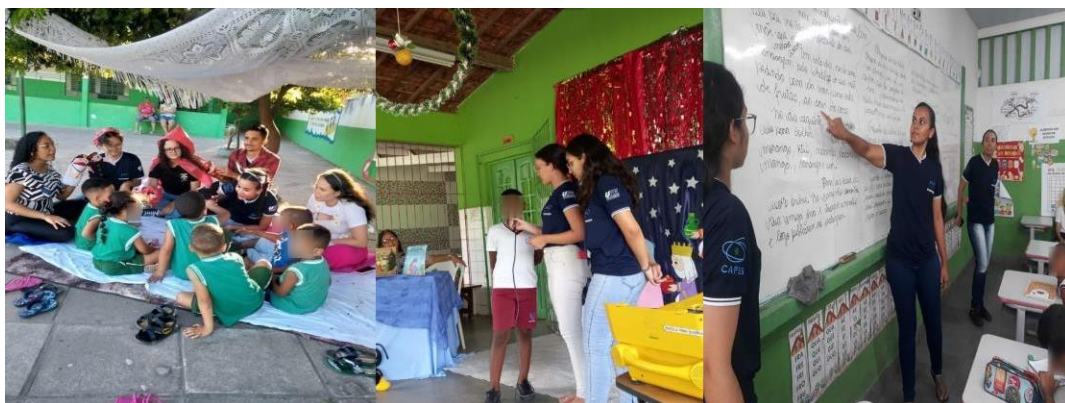
Imagem 2: Ações desenvolvidas com a comunidade escolar nas escolas-campo.

Contudo, uma das principais atividades do PIBID consiste na realização de intervenções pedagógicas nas escolas- campos. Essas intervenções permitem aos bolsistas desenvolverem projetos educativos inovadores, aplicar metodologias ativas de ensino e contribuir para a melhoria da qualidade do ensino-aprendizagem nas instituições de educação básica assim como trazer ao espaço acadêmico situações observadas nas escolas. Em síntese, observamos que neste contexto dialógico tanto a comunidade escolar como a instituição de ensino superior são beneficiadas ao fomentar espaços para a articulação entre teoria e prática necessárias à formação dos docentes, elevando a qualidade nos cursos de licenciatura.