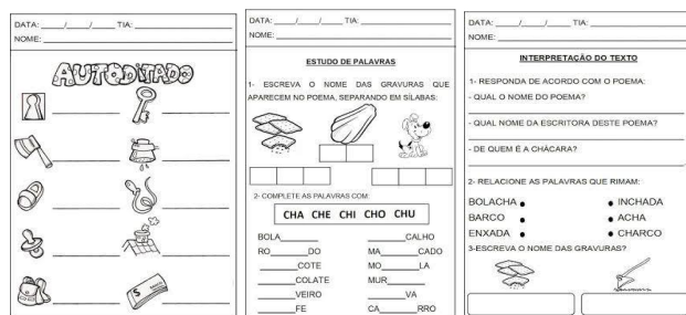
Figuras 2- A seguir algumas atividades que foram trabalhadas em sala de aula:

compreendido o contexto poético, estavam assimilando e construindo seus aspectos cognitivos como também o pensar, analisar e interpretar o que era proposto. Percebemos o desenvolvimento na escrita a partir das atividades realizadas com o poema para escrever as sílabas faltosas, no caso as sílabas complexas, escrita de palavras e com o autoditado.