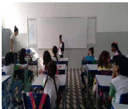
Figura 1- As crianças fazendo a leitura do poema:

Na primeira aula apresentamos a eles o poema; “A Chácara do Chico Bolacha”, para que conhecessem o nome do poema à ser estudado, a autora, sua estrutura, e durante os encontros antes de iniciarmos convidamos os alunos para ler um verso ou estrofe, pois eles gostavam de participar das atividades, prontamente queriam participar, até os que estavam ainda em desenvolvimento da leitura, ou seja, lendo palavras e frases. Diante disso, foi muito gratificante ver o empenho e dedicação dos alunos diante deste momento de despertar o gosto e o hábito pela leitura e, sobretudo, o hábito de ouvir os colegas também.