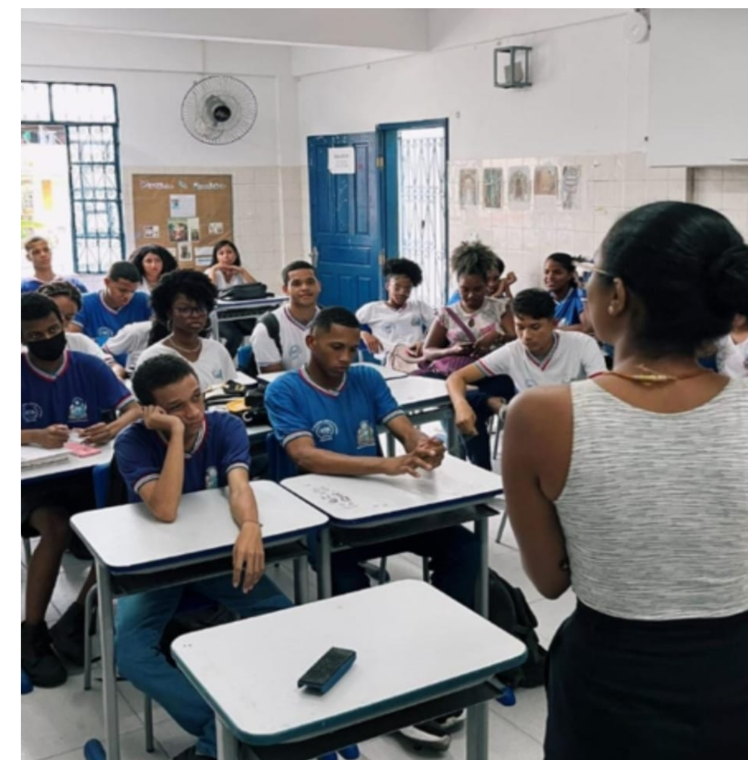
Figura 3. Aula sobre a lei 10.639/03