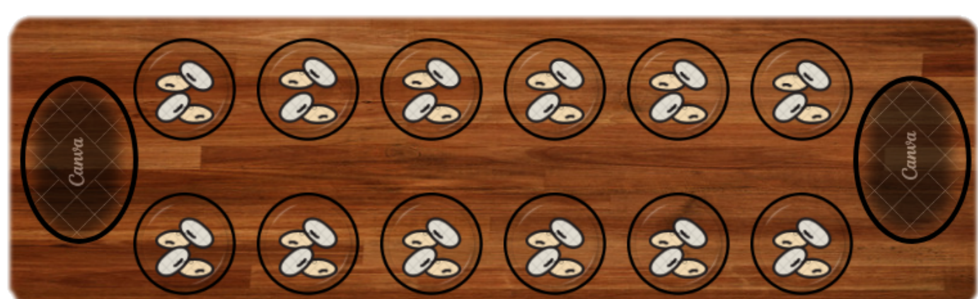
Figura 1- Ilustração do tabuleiro do jogo Mancala

Além disso, a integração da Lei 10.639/03 durante a atividade estimulou discussões significativas sobre a valorização da diversidade cultural, cumprindo os princípios da legislação que exige o ensino da história e cultura afro-brasileira e indígena. A abordagem interdisciplinar promovida pelo Mancala como ferramenta educacional permitiu conectar conceitos da astronomia, história, antropologia e matemática, enriquecendo a experiência educacional dos alunos.