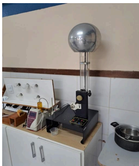
Figura 1. Gerador de Van der Graaff

Nossa iniciativa não apenas transformou o ambiente físico do laboratório, mas também criou uma base sólida para o uso mais eficiente e pedagógico desse espaço. Acreditamos que a organização e a facilidade no uso dos recursos contribuirão significativamente para o desenvolvimento das atividades experimentais de investigação no Colégio Estadual Mestre Paulo dos Anjos, promovendo um melhor engajamento dos estudantes no aprendizado. Nas Figuras 1 e 2 mostramos alguns dos experimentos disponíveis na instituição e suas condições de uso.