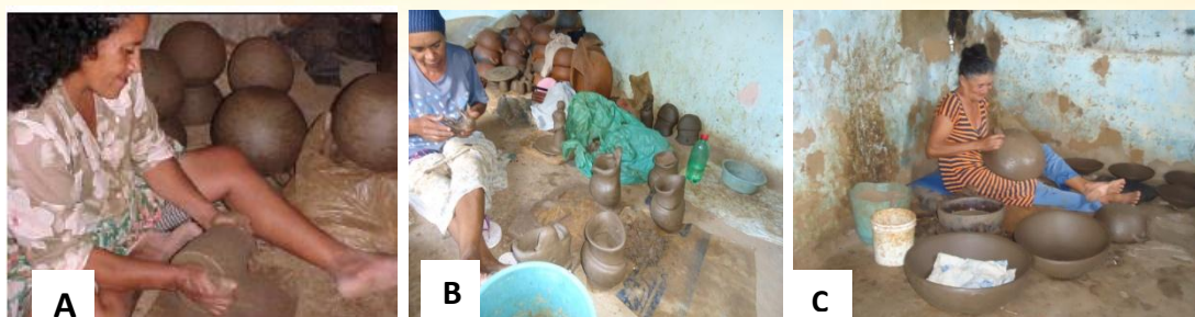
Figura 2. Produção das loiças de barro; a) Forma inicial do barro a ser moldado; b) Fase de dar forma às peças; c) Fase de acabamento.

A pesquisa se desenvolveu em cinco etapas: pesquisa bibliográfica e documental; aproximação às famílias e ao ambiente, que permitiu, dentre outras questões, a seleção da amostra; aplicação de questionário semiestruturado; coleta de amostras das águas disponíveis na comunidade e análise de sua qualidade; visitas à Unidade Básica de Saúde da Comunidade; visitas às residências e conversas sobre casos de diarreia na família. Foram feitos, ainda, contatos com a equipe médica que autorizou aos de pesquisa da UEPB realizar o levantamento dos casos de diarreia dos anos 2013, 2014 e 2015 nos arquivos da Unidade Básica.