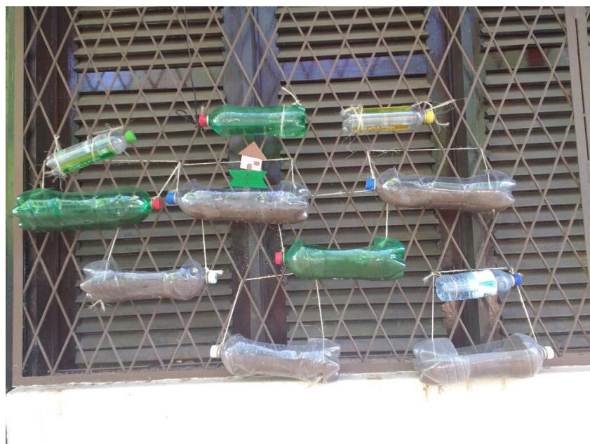
Imagem 3. Horta vertical e método de irrigação finalizados.