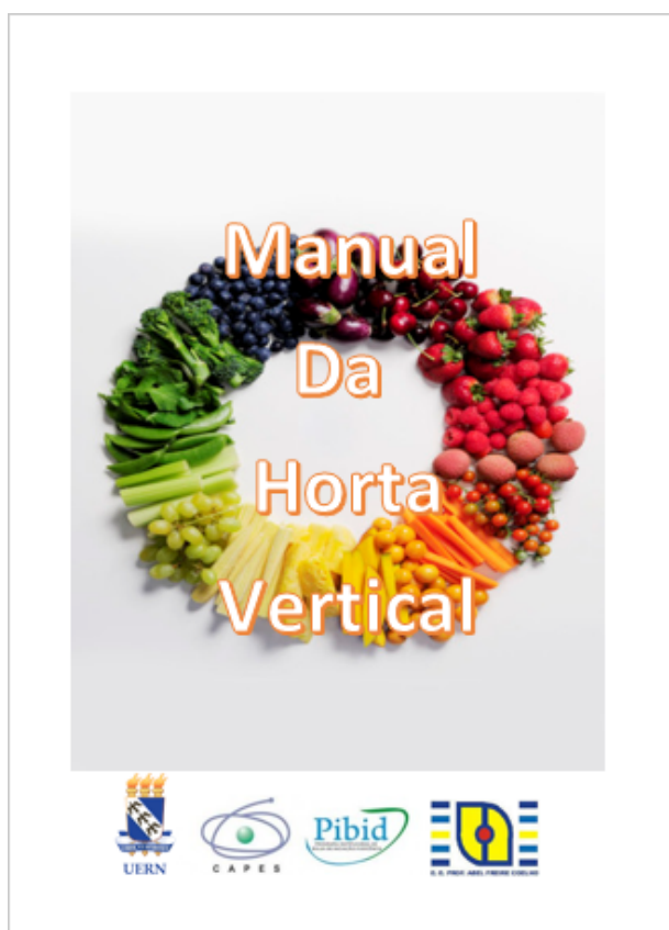
Imagem 5. Capa do manual da horta vertical.