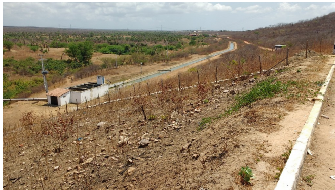
Figura 2: Canal do Açude Sítios Novos

poluição, como lixões a céu aberto na bacia hidráulica do açude, atividades de piscicultura intensiva (gaiolas), que inclusive não possuíam outorga. Constatou-se, no entanto, grandes manchas e áreas antropizadas a montante do reservatório. A faixa de proteção do açude apresenta-se, de modo geral, preservada, sendo que as áreas degradadas mais significativas observadas, encontram-se no trecho final do reservatório e, imediatamente a jusante, a mata ciliar do rio foi substituída, por alguns quilômetros, por áreas de cultivos agrícolas.