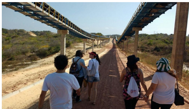
Figura 3: Imagens das esteiras de grande porte utilizadas no transporte do minério.

Em análise ao depoimento da comunidade da lagoa, também afetada pela construção do CIPP e principalmente com a instalação de 2 esteiras (Figura 3) utilizadas no transporte de minério para as termelétricas foi ponto de discussão. Em 2016 foi inaugurada, ainda com previsão para implantação de mais duas esteiras transportadoras de insumos (carvão e minérios) para região. A esteira tem irregularidades desde a sua implantação, do tipo de construção e do tipo de técnica utilizada. A primeira alimenta a UTE e outra a siderúrgica. O impacto do pó do carvão na saúde das comunidades próximas as esteiras é fato comprovado (casos de leucemia e insuficiência pulmonar foram constatados). Podendo-se, além disso, citar os ruídos comparados a decolagem de um avião comercial, não respeitando os limites de decibéis.