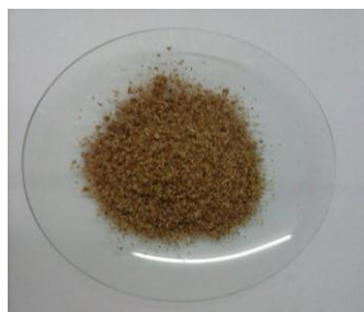
Figura 2. Adsorvente natural obtido a partir da semente