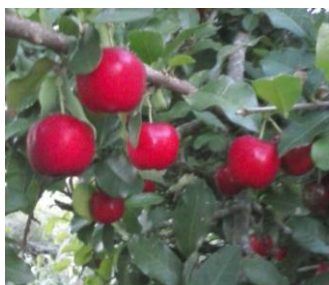
Figura 1. Frutos da aceroleira.

Os frutos da aceroleira (Figura 1) foram coletados em uma área particular na zona rural do município de Cuité-PB. As sementes foram separadas da casca e poupa do fruto, em seguida secas e trituradas para a obtenção do adsorvente (Figura 2). Para a montagem da coluna cromatográfica foram pesados 6g do adsorvente e posteriormente a amostra foi lavada previamente com água destilada até que a água residual da lavagem estivesse límpida.