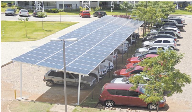
Figura 1 – Placas solares no estacionamento