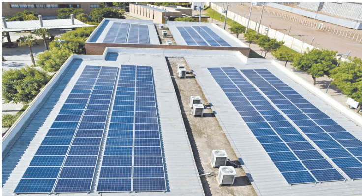
Figura 3 – Placas solares nos telhados