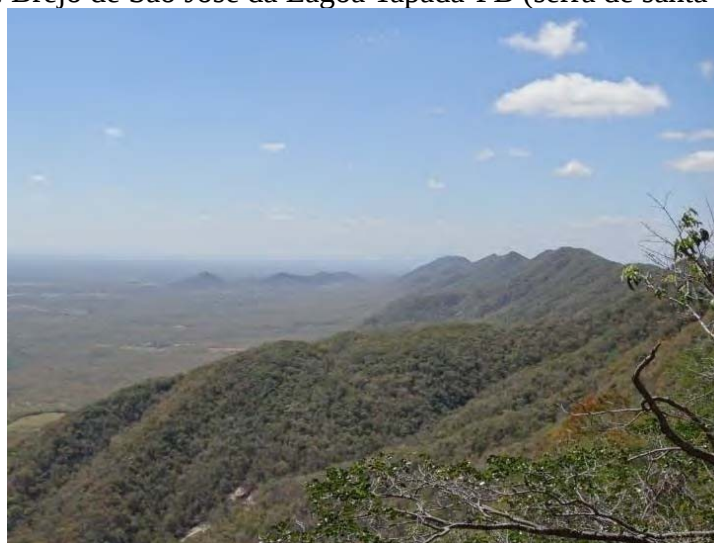
Figura 5. Brejo de São José da Lagoa Tapada-PB (serra de santa Catarina).

A (Figura 5) tem como recorte o município de São José da Lagoa Tapada, há predominância de serras incrustadas no domínio da depressão sertaneja, como a serra de Santa Catarina que, segundo MMA (2003), possui uma biota vegetal de elevada importância biológica. Pode-se observar, no brejo de altitude, uma variação fitoecológica que reúne desde Caatingas a Floresta Estacional Decidual. Segundo FUNBIO (2014), já está em andamento o projeto que institui a Serra de Santa Catarina como uma Unidade de Conservação, cuja área irá alcançar cerca de 112,1 Km 2 , e vai abranger os municípios de Aguiar, Coremas, São José da Lagoa Tapada, Nazarezinho e Carrapateira.