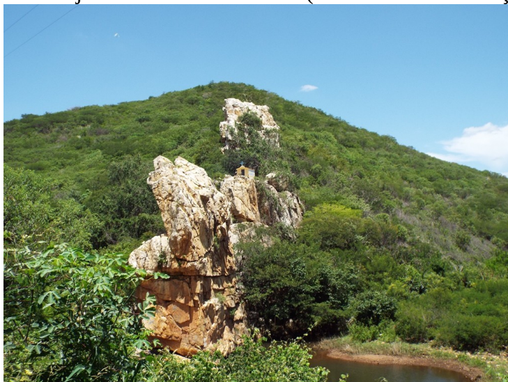
Figura 3. Brejo de Princesa Isabel- PB (serras do saco dos caçulas).

A (Figura 3) tem como recorte o município de Princesa Isabel, uma área de tensão entre o maciço do Teixeira-PB e do Triunfo-PE, neste o relevo residual se configura serrano e com cristas graníticas. A fitoecologia do brejo de altitude da área é formada pela Floresta Estacional Decídua Montana e a Caatinga, num domínio regional de extrema importância biológica e prioritária para conservação do domínio Caatinga, segundo MMA (2003).