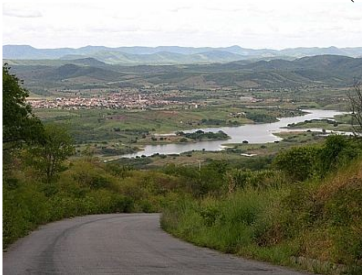
Figura 4. Brejos de altitude de São José de Piranhas e Monte Horebe- PB (serra Monte Horebe).