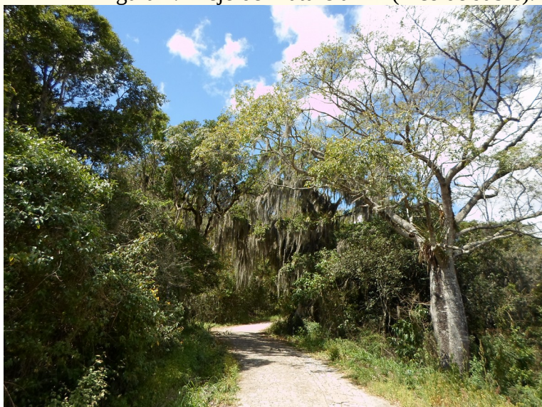
Figura 2. Brejo de Maturéia-PB (Pico do Jabre).