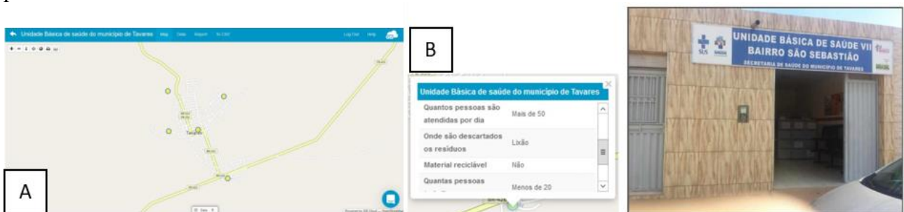
Fig. 4 – (A) Distribuição espacial das UBS de Tavares – PB; (B) Dados sobre a unidade básica de saúde do bairro de São Sebastião, em Tavares –PB.

Caso 3: Unidades básicas de saúde do município de Tavares – PB. As unidades básicas de saúde (UBS) são os estabelecimentos públicos de saúde responsáveis por atender os pacientes locais, onde estão inseridas com o objetivo de promover a saúde, incentivar a prevenção doenças, bem como diagnosticá-las e encaminhar os pacientes para estabelecimentos de maior porte quando necessário. O formulário digital conteve os seguintes campos (tipos): ID (número); hora do mapeamento (data-hora); foto (imagem); quantas pessoas são atendidas por dia? (radio); onde são descartados os resíduos? (radio); o material descartado é reciclado? (radio); quantos trabalhadores? (radio); longitude (texto); latitude (texto). Observa-se na Figura 4 (A) a distribuição espacial das cinco UBS da cidade de Tavares - PB. Na Figura 4 (B) são apresentadas as informações sobre um determinado ponto coletado.