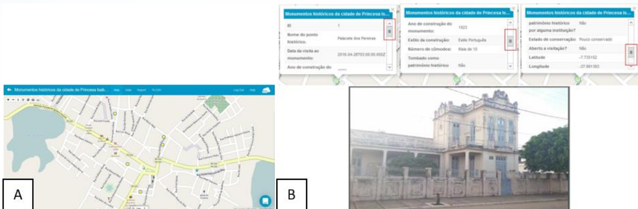
Fig. 3 - (A) Distribuição espacial da amostra de prédios históricos na cidade de Princesa Isabel; (B) Dado coletado sobre o Palacete dos Pereiras, famosa edificação da cidade.

Caso 3: Unidades básicas de saúde do município de Tavares – PB. As unidades básicas de saúde (UBS) são os estabelecimentos públicos de saúde responsáveis por atender os pacientes locais, onde estão inseridas com o objetivo de promover a saúde, incentivar a prevenção doenças, bem como diagnosticá-las e encaminhar os pacientes para estabelecimentos de maior porte quando necessário. O formulário digital conteve os seguintes campos (tipos): ID (número); hora do mapeamento (data-hora); foto (imagem); quantas pessoas são atendidas por dia? (radio); onde são descartados os resíduos? (radio); o material descartado é reciclado? (radio); quantos trabalhadores? (radio); longitude (texto); latitude (texto). Observa-se na Figura 4 (A) a distribuição espacial das cinco UBS da cidade de Tavares - PB. Na Figura 4 (B) são apresentadas as informações sobre um determinado ponto coletado.