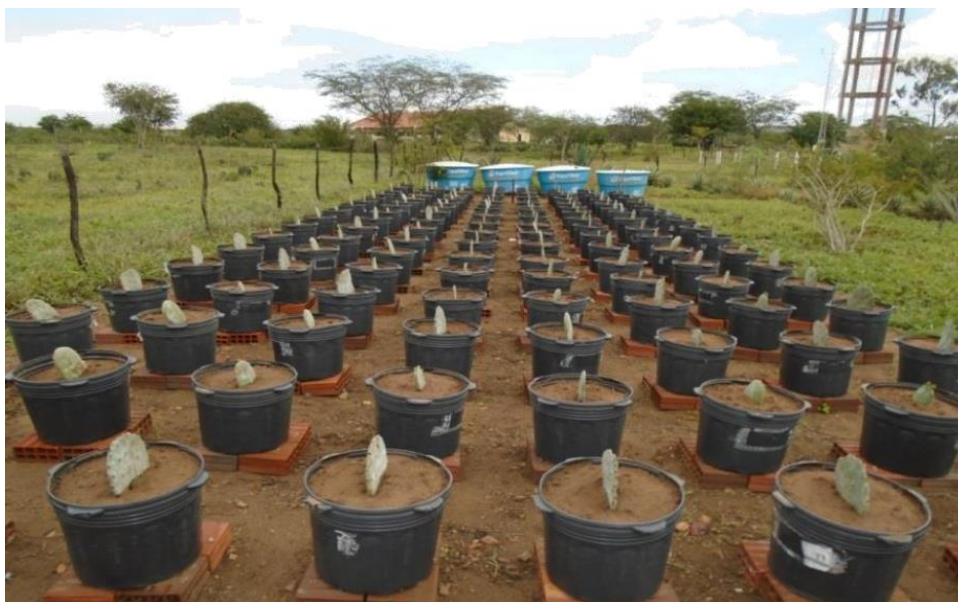
Figura 1 – Área experimental: produção de palma irrigada com concentrações diferentes de NaCl.

O experimento foi realizado na Estação Experimental do Instituto Nacional do Semiárido, em Campina Grande, PB (07°16'41" S e 35°57'59" O, altitude média de 470 m, em vasos com capacidade de 40 L e em ambiente não controlado (Figura 1).