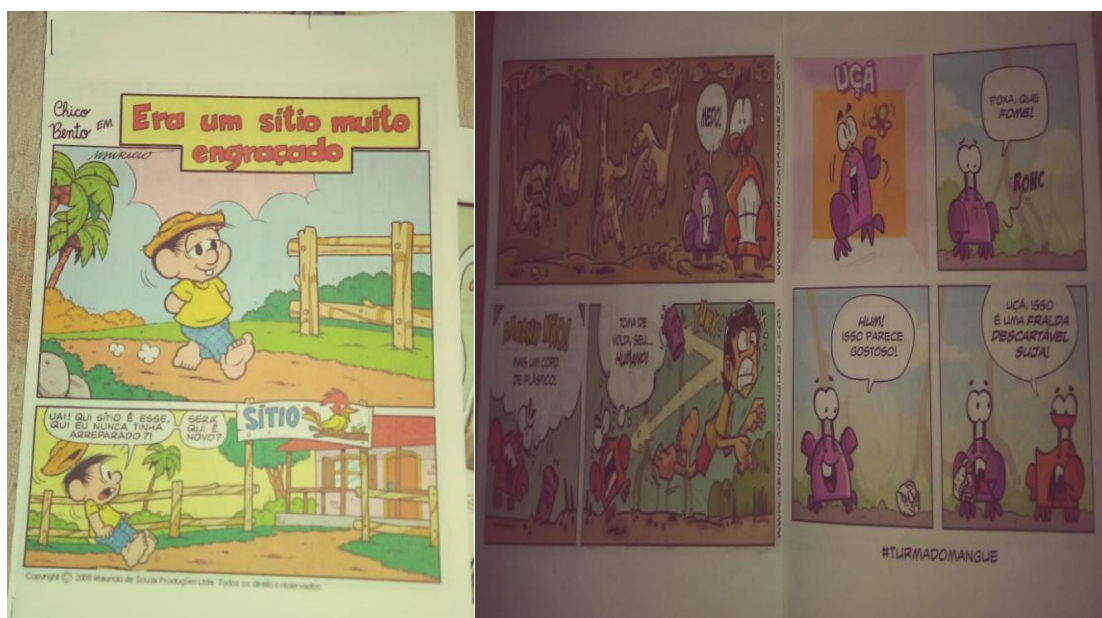
Figura I: HQs e tirinha usadas na aula.

Para Nicola (2016), quando o recurso utilizado demonstra resultados positivos, o aluno torna-se mais confiante, capaz de se interessar por novas situações de aprendizagem e de construir conhecimentos mais complexos. Acabando por despertar o seu lado criativo e artístico a partir desse envolvimento com o conteúdo que está sendo discutido, proporcionando, assim, uma melhor percepção e interpretação da aula. As figuras I e II, mostram as HQs e tirinhas que foram aplicadas na atividade.