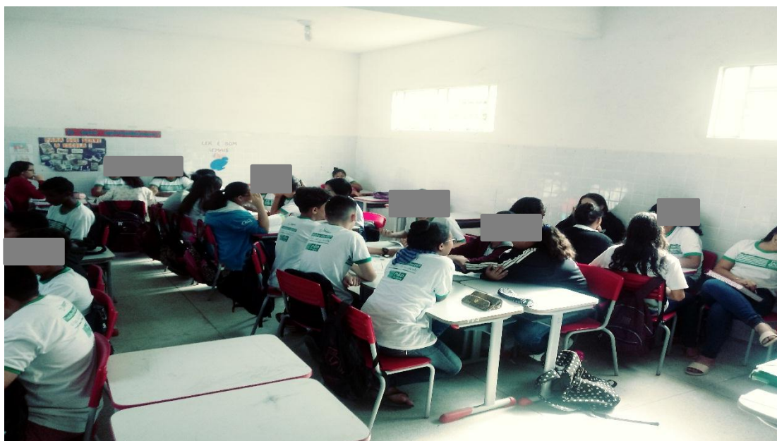
Figura IV: Alunos realizando a atividade.