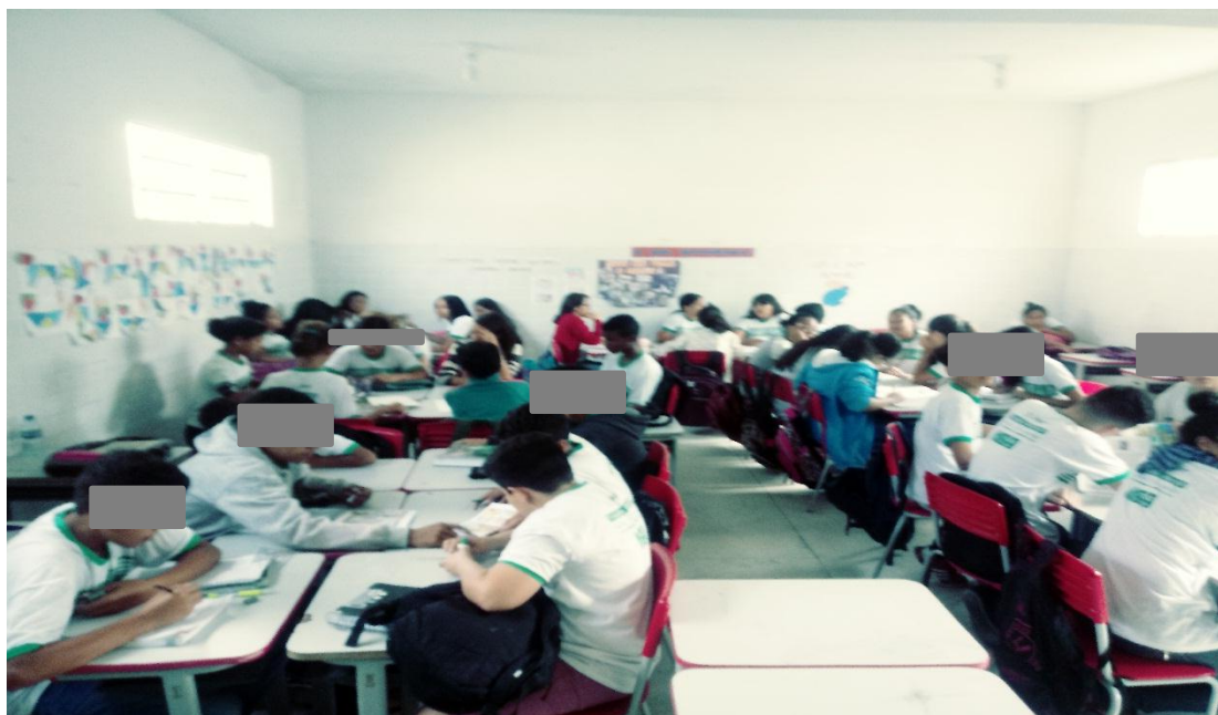
Figura III: Alunos realizando a atividade.