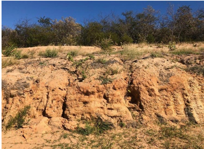
Figura 7 – Processo erosivo próximo aos aerogeradores (A); Erosão eólica (B).