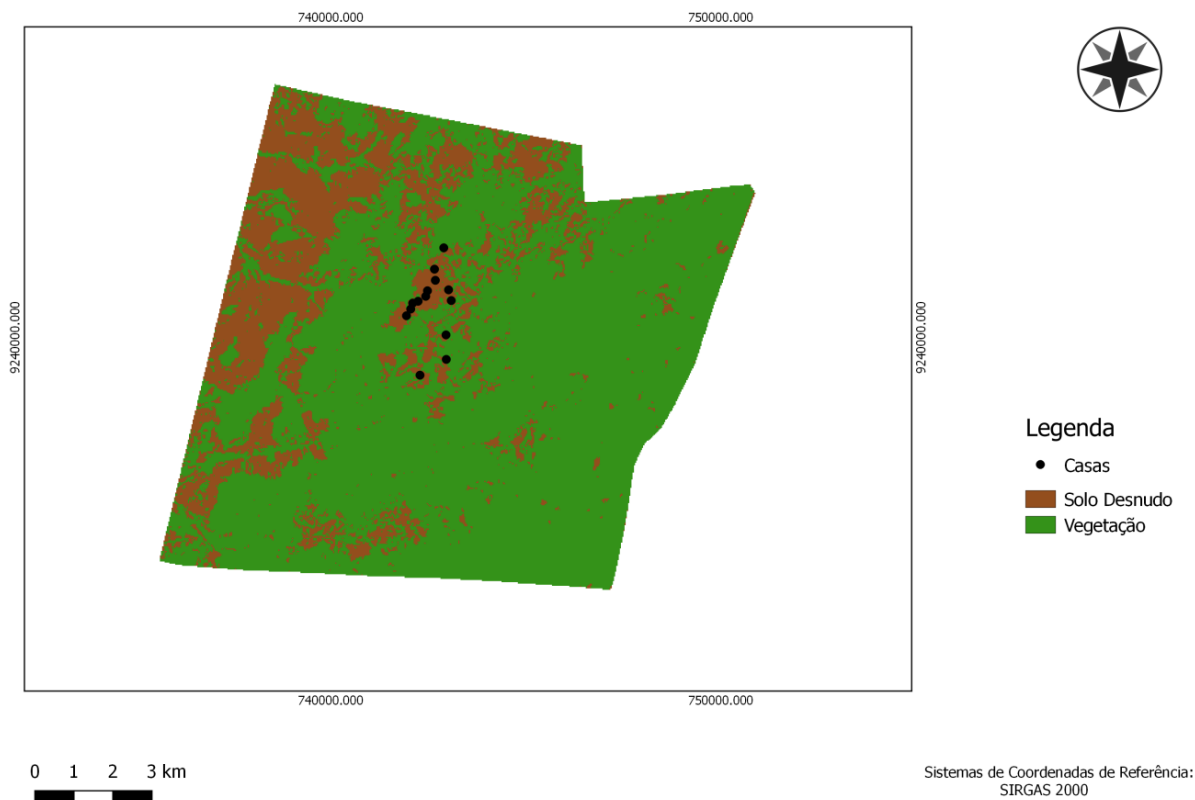
Figura 2 - Mapa de Uso e Ocupação do solo no ano de 2008