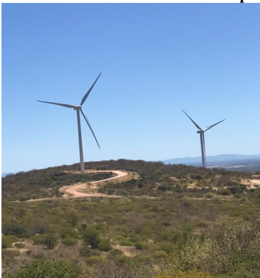
Figura 5 - Abertura de estradas para instalação de aerogeradores (A) e Alterações paisagísticas (B).

Para a construção do parque eólico, fez-se necessário à abertura de estradas para instalação dos aerogeradores (Figura 5), para isso, foi necessário à retirada da cobertura vegetal para sua implantação. Além de uma mudança paisagística, as áreas sofrem bastante em decorrência dessa remoção, pois a cobertura vegetal atua como forma de proteção do solo contra erosões, além de resguardar a fauna e flora e equilibrar a temperatura local.