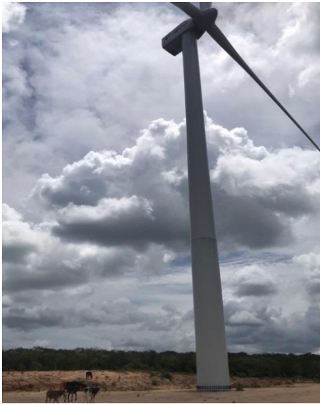
Figura 4 - Animais nas proximidades dos aerogeradores (A); Possíveis compactações do solo devido à presença de animais (B).