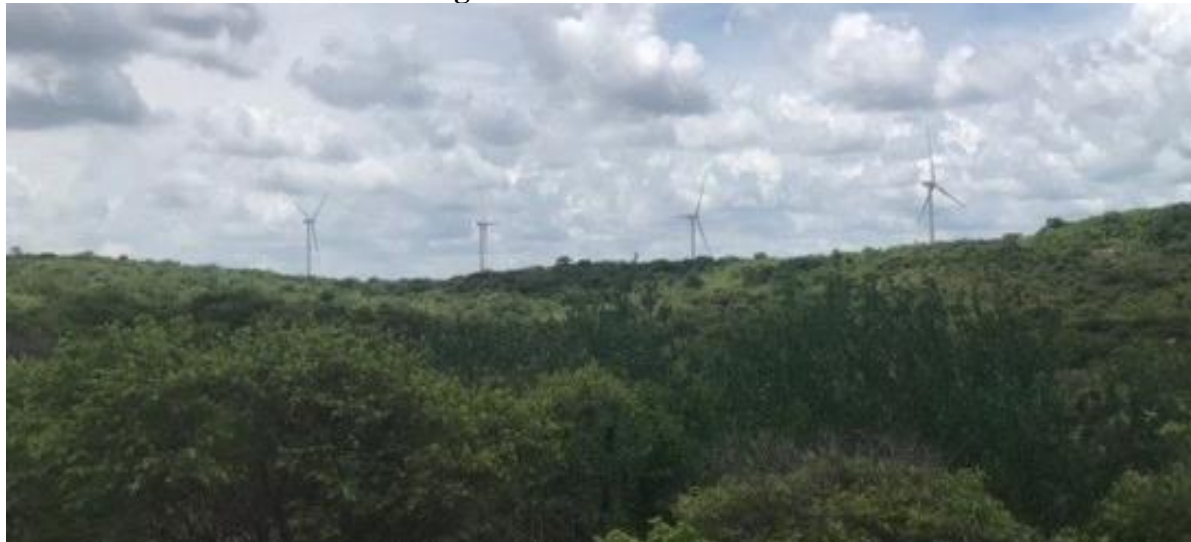
Figura 6 - Intrusão visual

A intrusão visual é qualquer alteração do meio natural que possa afetar a qualidade estética do local, incomodar ou comprometer a visibilidade; intervir no modo de vida das pessoas (FOGLIATTI et al., 2004), e como evidenciado na Figura 6, os aerogeradores são um exemplo disso. Modificar o meio natural, inserindo as torres e turbinas eólicas pela ação antrópica altera o local.