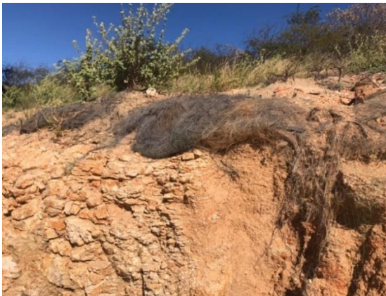
Figura 8 - Utilização de mantas de coco na área estudada (A); Mantas de capim buffel (B).

Após a instalação dos parques, houve a implantação de mantas de coco, por meio da empresa que instalou os parques (Comunicação pessoal), as que funcionam como uma proteção para o solo e para as áreas degradadas em alguns pontos próximos aos aerogeradores. De acordo com Correa (2002), as mantas de cocos são utilizadas para controlar as erosões como também para crescimento e desenvolvimento de vegetações de áreas degradadas, sendo bastante eficazes nos processos erosivos decorrentes da ação de chuvas ou ventos, conforme apresentado na Figura 8.