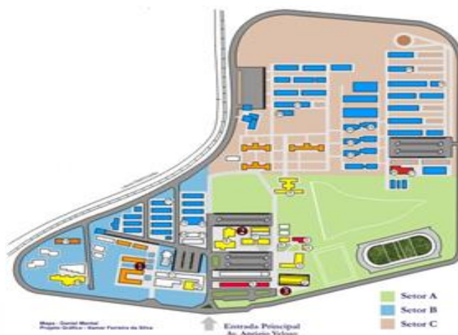
Figura 1- Representação dos Setores A, B e C da UFCG.

No campus de Campina Grande (Figura 1) que fica localizado no bairro Bodocongó, estão instalados vários Centros de Ensino, distribuídos nos setores A, B e C. Só será abordado nesse trabalho, o Restaurante Universitário, que fica localizado no setor A da Universidade.