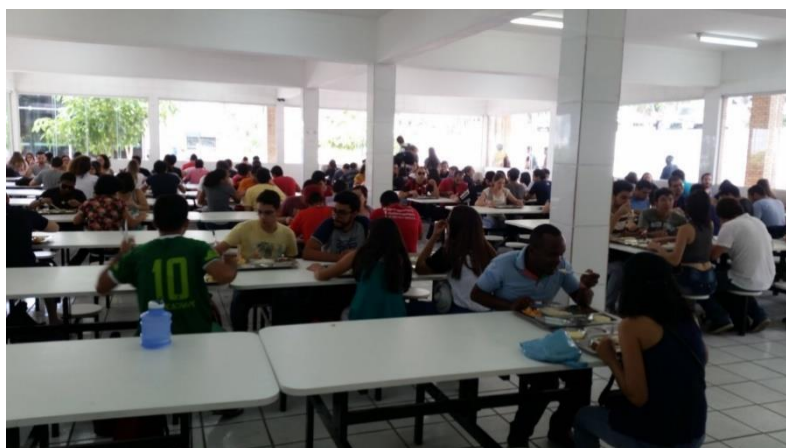
Figura 2 - Restaurante Universitário, UFCG - Campus Campina Grande.

O Restaurante Universitário (Figura 2) tem por finalidades atender com qualidade a comunidade estudantil da UFCG, servindo refeições balanceadas e higienicamente seguras no almoço e no jantar no campus de Campina Grande, bem como nos demais campi da UFCG de maneira totalmente gratuita para o alunado, promovendo assim, condições básicas necessárias para o bom desempenho das atividades de ensino-aprendizagem (Pró Reitoria de Assuntos Comunitários – PRAC, 2017).