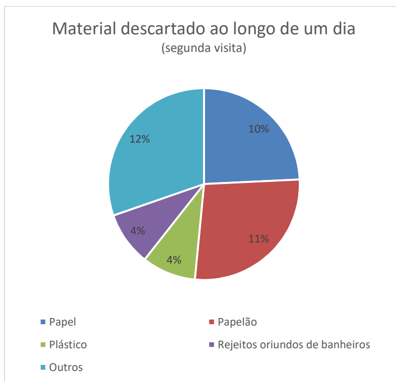
Gráfico 2: Levantamento Quantitativo.