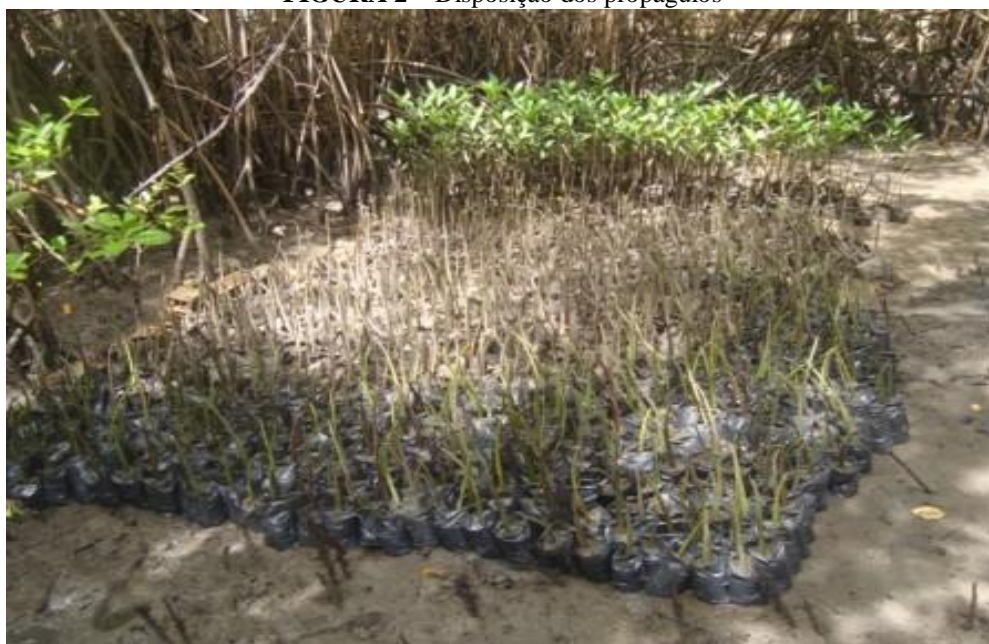
FIGURA 2 – Disposição dos propágulos

No entorno do local onde se desenvolveu o projeto, constatou-se que havia bastante resíduos sólidos jogado no manguezal pela própria população ribeirinha e pelo carreamento de resíduos sólidos vindos de outras áreas a montante do rio que sofrem interferência direta de banhistas, por isso é preciso trabalhar cada vez mais a educação ambiental.