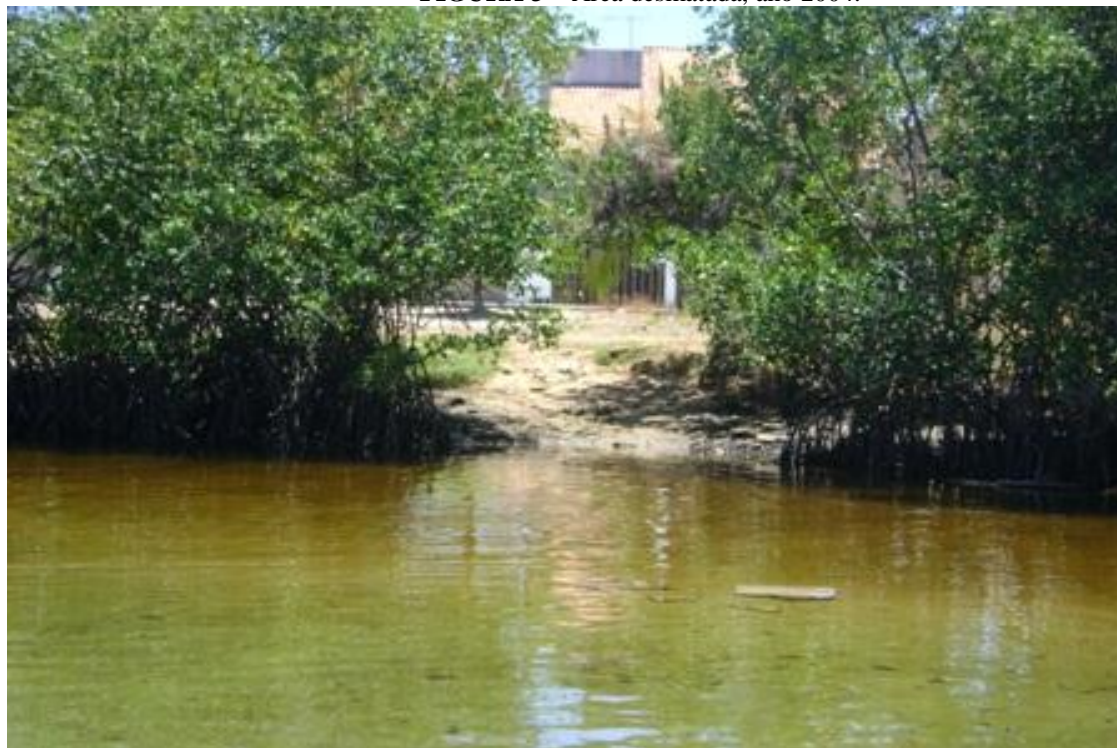
FIGURA 3 – Área desmatada, ano 2004.

O replantio das mudas produzidas foi feito em locais devastados localizados na margem anterior ao berçário de mudas, pois, preferiu-se fazer o plantio em áreas adjacentes por conta da similaridade do ambiente o que facilitou o desenvolvimento das plantas já que as mesmas foram cultivadas em condições ambientais semelhantes as do local do replantio. Nas Figuras 3 e 4, pode-se verificar a recuperação de uma área degradada em relação à Figura anterior.