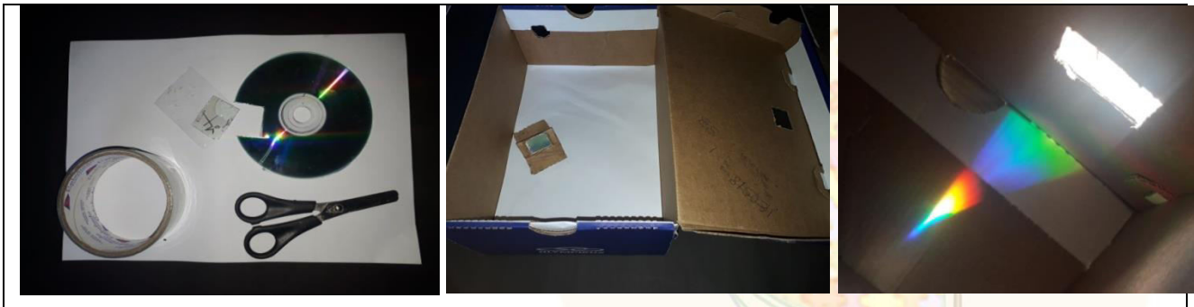
Figura 2 – Construção e execução do espectroscópio solar

Com o estilete foi feito um corte quadrado (aproximadamente 3 cm x 3 cm) do lado direito da caixa de sapato. Ainda com o estilete, foi feita uma abertura para observar em um dos lados de menor área da caixa de sapato.