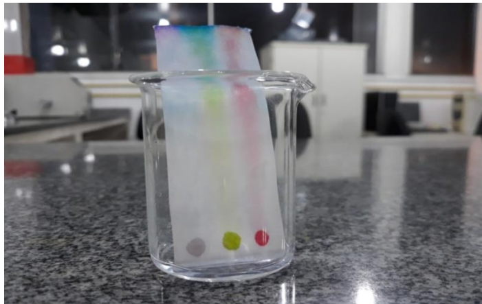
Figura 7: Separação das diferentes cores presentes no papel filtro.

O conteúdo de separação de misturas pode ser lembrado durante a aplicação desse experimento, também foi possível revisar outros métodos de separação de misturas e suas especificidades.