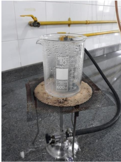
Figura 5: Preparo do reativo Kastle-Meyer.

Foi possível trabalhar com a turma algumas propriedades da matéria, como indícios de reação química, equações químicas, e constituição da matéria, dessa maneira, lembrando os assuntos, e foi possível que os alunos visualizassem as reações químicas envolvidas em todo o processo.