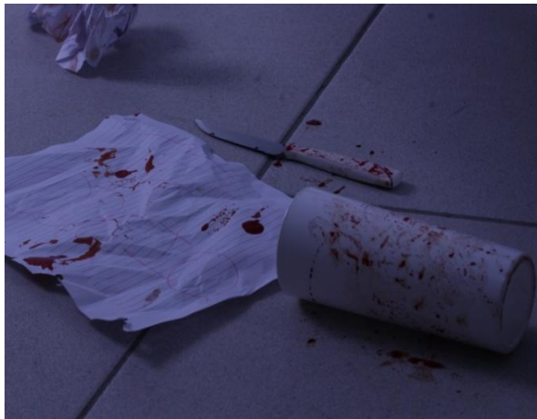
Figura 3: Parte do material analisado pelos alunos.