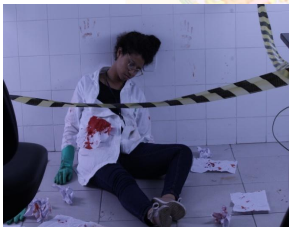
Figura 1: Cena do crime montada em sala de aula.

Para aplicação da metodologia foi montado uma cena de crime em uma sala de aula do IFPA, mostrado na Figura 1, onde os alunos foram levados para analisar a cena de crime. Foram feitas as discussões iniciais sobre a cena, e foram definidos para os alunos como seriam realizadas as análises laboratoriais dos vestígios encontrados na cena do crime. No local onde aconteceu o possível crime, se encontrava um corpo ensanguentado, ao redor do corpo havia muitos papéis com alguns dizeres e objetos espalhados pela cena.