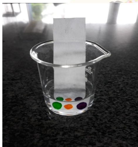
Figura 4: Béquer contendo papel filtro com pingos de canetas coloridas, inseridos em solução de Cloreto de Sódio a 5%.

A técnica utilizada para separação de misturas foi a cromatografia. Foram entregues aos alunos, três canetas coloridas nas cores violeta, verde e alaranjado. Em seguida, foram instruídos a cortar o papel de filtro em uma tira retangular e, com o auxílio de uma régua, traçar uma linha acima 1 cm da parte inferior do papel e, com um palito de dente, adicionar ao papel, um pingo de cada caneta, lado a lado. Após a preparação do papel de filtro, os alunos colocaram-no em um béquer contendo cerca de 10 mL de solução aquosa de cloreto de sódio a 5%, como mostrado na Figura 4, e então, posteriormente, foi possível visualizar a corrida no cromatograma..