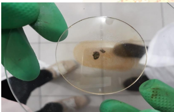
Figura 8: Formação da imagem da impressão digital a partir de absorção física.

Pode-se notar quando houve a formação da “névoa” violácea de iodo na fase vapor, o mesmo vapor interagiu com a impressão digital, a partir desse momento, explicou-se para os alunos que o processo ocorre por meio de uma absorção física, formando a imagem da impressão digital, mostrado na Figura 8, presente no material analisado. A partir da utilização desta prática foi possível retomar o conteúdo de propriedades da matéria, referindo-se as propriedades físicas, como a sublimação do iodo.