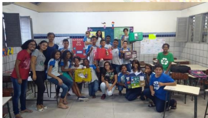
Figura 03. Alunos da escola Plácido de Almeida e alunos do curso de Licenciatura em Ciências Biológicas.

Por fim, foi realizada uma revisão de tudo o que tinha sido aplicado na oficina. Os alunos demonstraram bastante domínio no assunto, uma vez que o conteúdo de resíduos sólidos está presente na realidade daqueles discentes. Assim, a oficina foi encerrada (Figura 03).