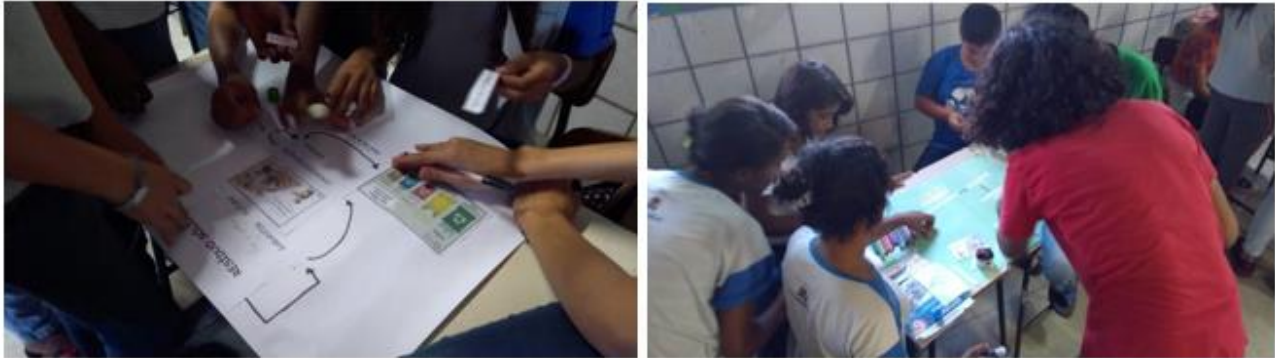
Figura 02. Produção de mapas conceituais pelos alunos da escola Plácido de Almeida.

aprendizagem. A Figura 02 mostra as atividades que foram realizadas pelos alunos com o auxílio dos estudantes do curso de Ciências Biológicas. Dessa forma, foram construídos mapas conceituais com todo o conteúdo que tinha sido trabalhado através das metodologias ativas.