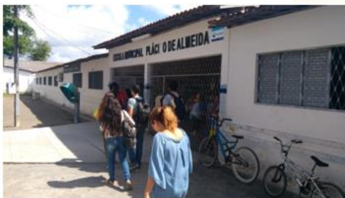
Figura 01. Visão geral da escola Plácido de Almeida e os coletores seletivos utilizados no “basquete”.

A ideia de realizar o presente trabalho surgiu com base nas discussões realizadas na disciplina de Educação Ambiental (EA) do Curso de Licenciatura em Ciências Biológicas do IFPB Cabedelo. Nesta disciplina, houve uma avaliação que consistiu em desenvolver uma oficina pedagógica na escola Plácido de Almeida, localizada no bairro Renascer, Cabedelo/PB (Figura 01). O tema sugerido pela escola foi “resíduos sólidos” e a estratégia metodológica escolhida por nós para trabalhar o tema foi a oficina pedagógica.