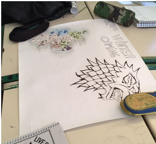
Figura 4: Produção dos territórios 1

que também fossem definidos temas como etnia da população e religiões dominantes, temas que, atualmente, também são motivos de guerras internas em muitos países.