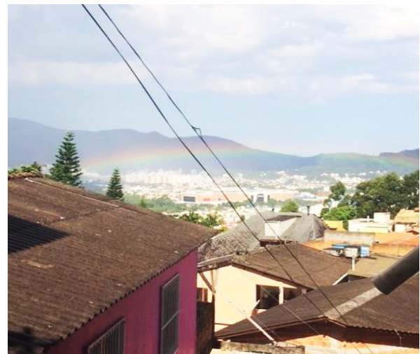
Figura 3: “Do meu lugar”