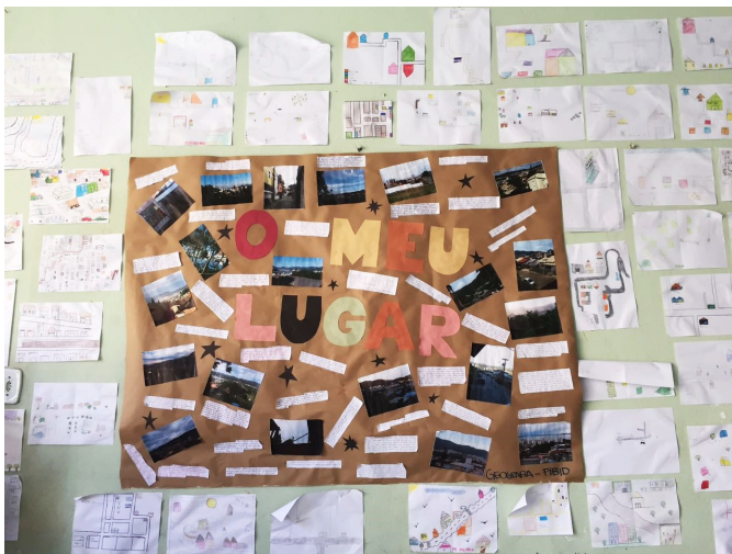
Figura 2: Mural Cultural

A execução de uma atividade interdisciplinar despertou o interesse dos/as estudantes que possuíam afinidade com os temas trabalhados, fazendo com que o processo de ensino-aprendizagem ocorresse de forma interativa, participativa e lúdica.