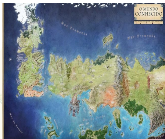
Figura 7: Mapa de Game of Thrones