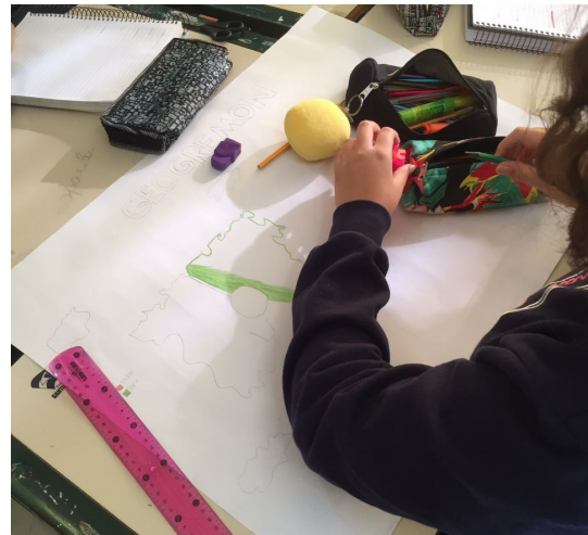
Figura 5: Produção dos territórios 2