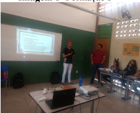
Imagem 1- Formação I

No primeiro encontro, falamos sobre protagonismo juvenil, como surgiu e suas principais características. Com o intuito de incentivar os discentes à tomada do seu lugar na sociedade, mostrar que eles podem transformar o meio em que vivem, e que nos dias atuais ganham o poder de influir na comunidade, artifício este que outras gerações não tiveram. Esse foi o nosso primeiro contato com os alunos em sala de aula e percebemos que eles receberam muito bem o projeto e gostaram bastante por ser algo totalmente voltado a juventude.