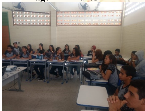
Imagem 2- Alunos