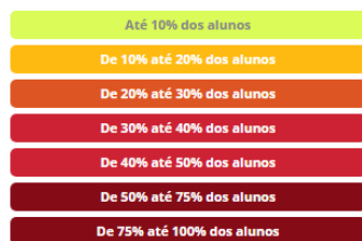
Legenda Distorção Idade Série