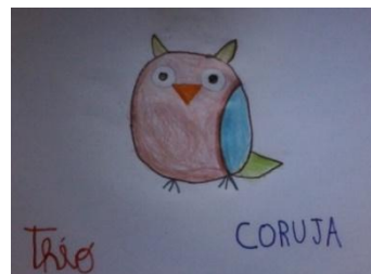
Acervo Pessoal: Desenho das Crianças de Petrópolis do Passo a Passo da Coruja