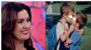
Novela apresentará primeiro beijo gay infantil-Diz Fátima Bernades

Utilizamos: PT Não Vai Reconhecer Resultado De Eleição Se Lula Não For Candidato, Diz Partido