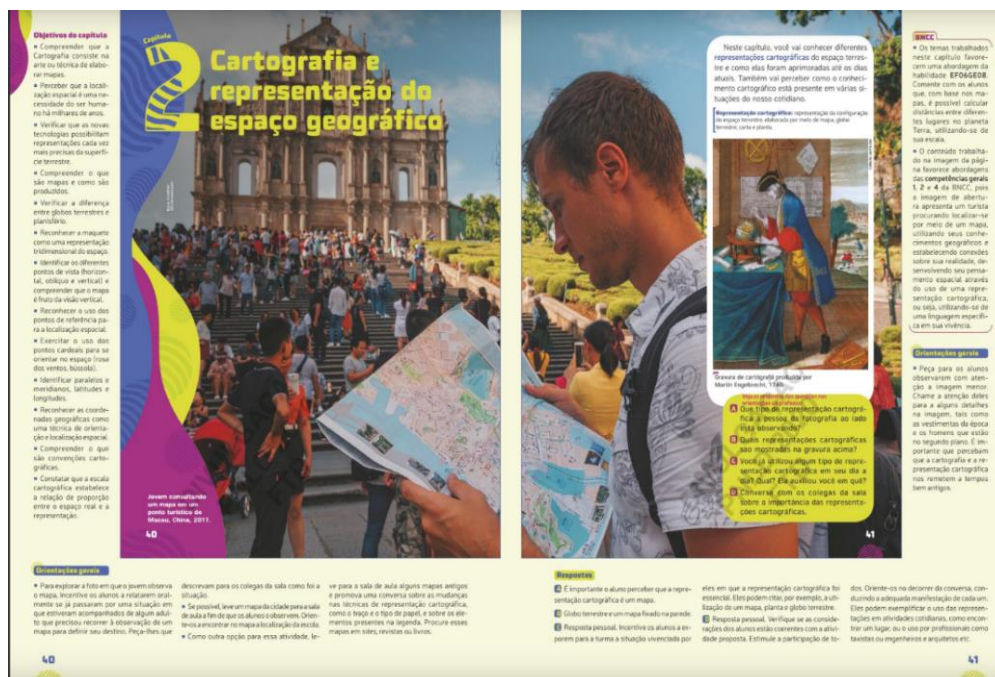
Figura 1- Livro do 6º ano: páginas de abertura do Capítulo 2