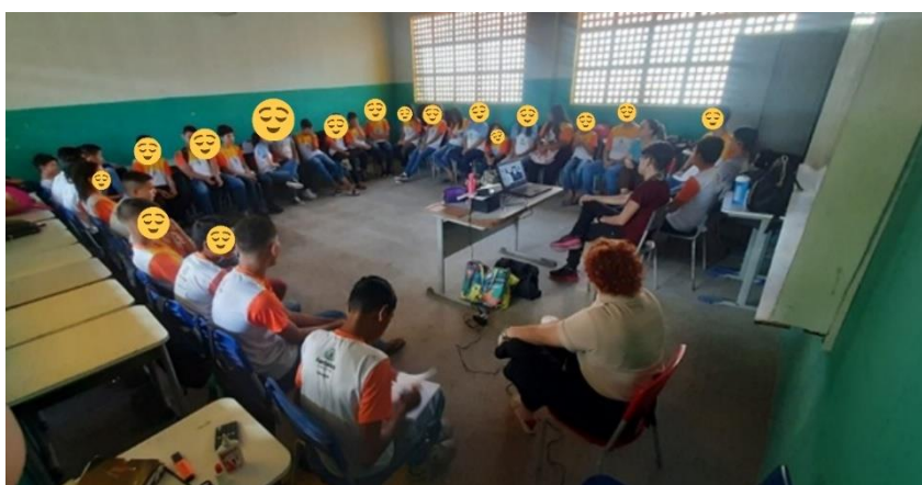
Foto 3: Roda de conversa sobre o tema Objetificação e erotização dos corpos – 8°C.

Os alunos e alunas puderam expor suas ideias, dar exemplos, questionar, discordar e propor soluções para a problemática. Intencionou-se estabelecer um ambiente de respeito, procurando superar a visão superficial e alienada do mundo, permitindo que os alunos e alunas construam um conhecimento mais integrado e significativo. Depois dessa primeira roda de conversa, durante o primeiro semestre de 2023, se seguiram outras 3, ou seja, em cada semestre serão realizadas 4 rodas de conversa, obedecendo à mesma sistematização. Os temas das rodas de conversa do 1º semestre, além deste primeiro, foram: “Bullying: como combatê-lo”, “Relação entre nutrição e transtornos de autoimagem em adolescentes” e “Racismo: o preconceito explícito e o velado”.