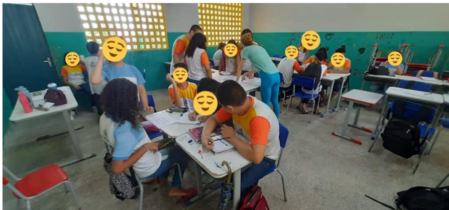
Foto 1: Escolha dos temas para as rodas de conversa – 8ªA.

Após esse momento, novamente foi feita a relação tema-objeto de conhecimento e foi-se vendo os temas que mais eram escolhidos para, assim, pensar nas rodas de conversa.