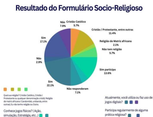
Figura 1 - Gráfico do questionário socio-religioso.

Fonte: Autores do questionário Francisco Canindé da Silva e Mateus Soares Fernandes.