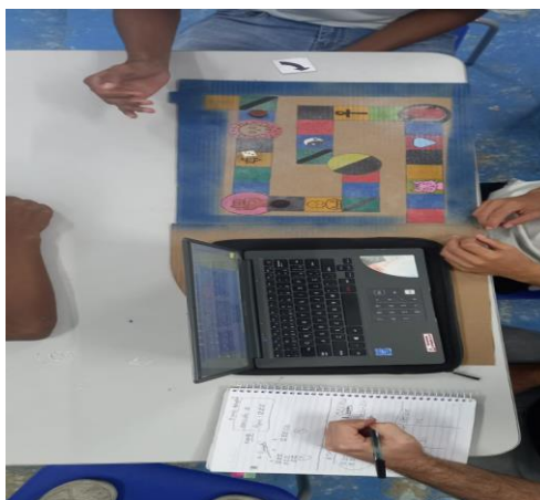
Figura 6 - A jornada das habilidades do Ensino Religioso.