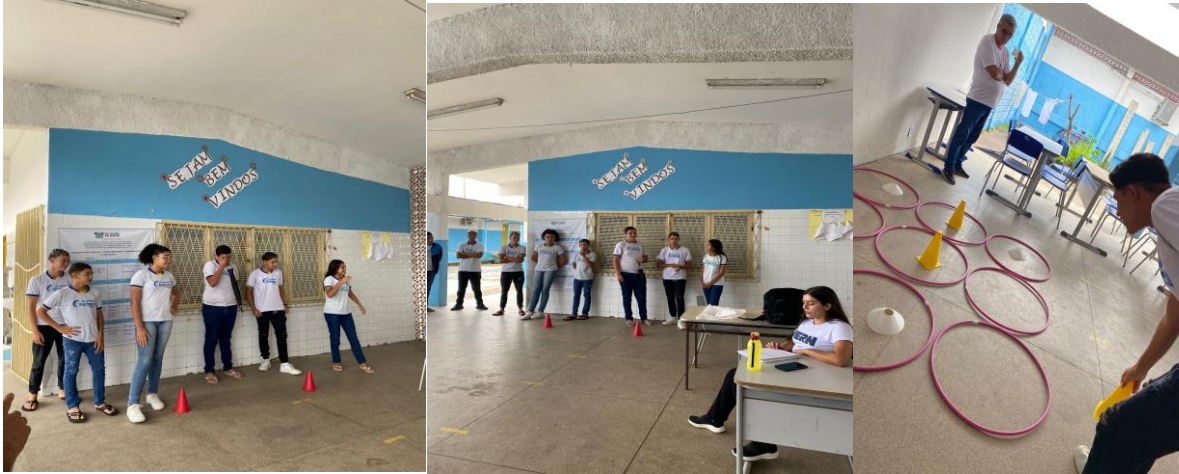
Figuras 2, 3 e 4: Jogo da Velha Humano em execução.