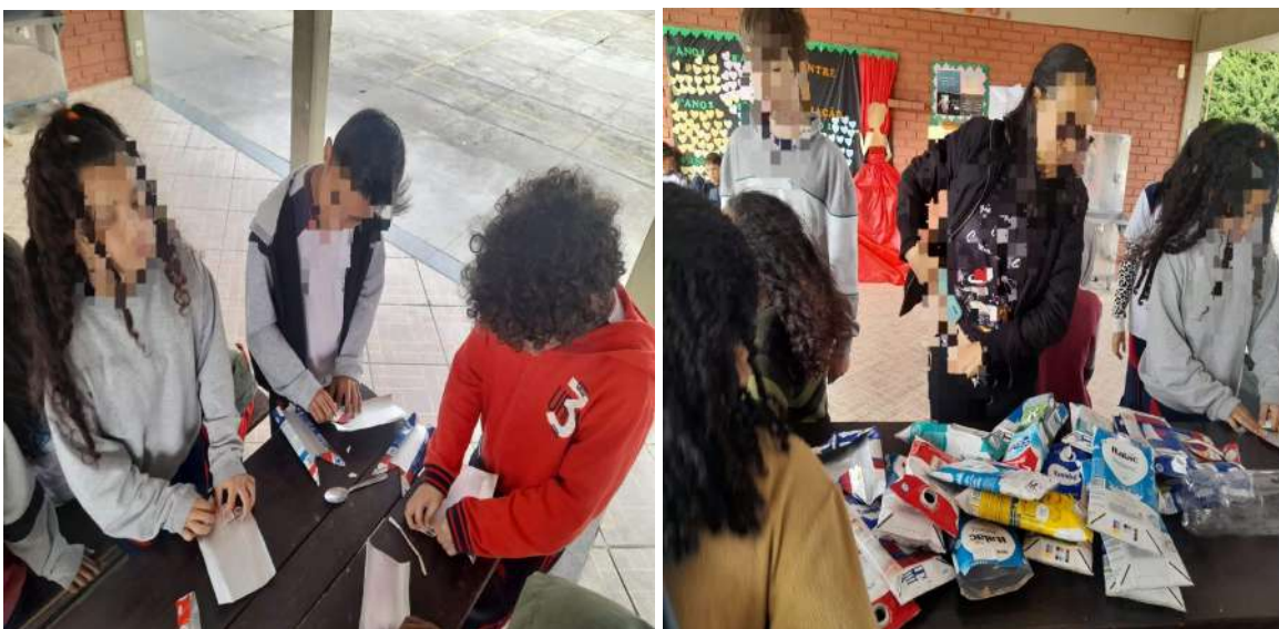
Figuras: Corte e montagem das caixinhas