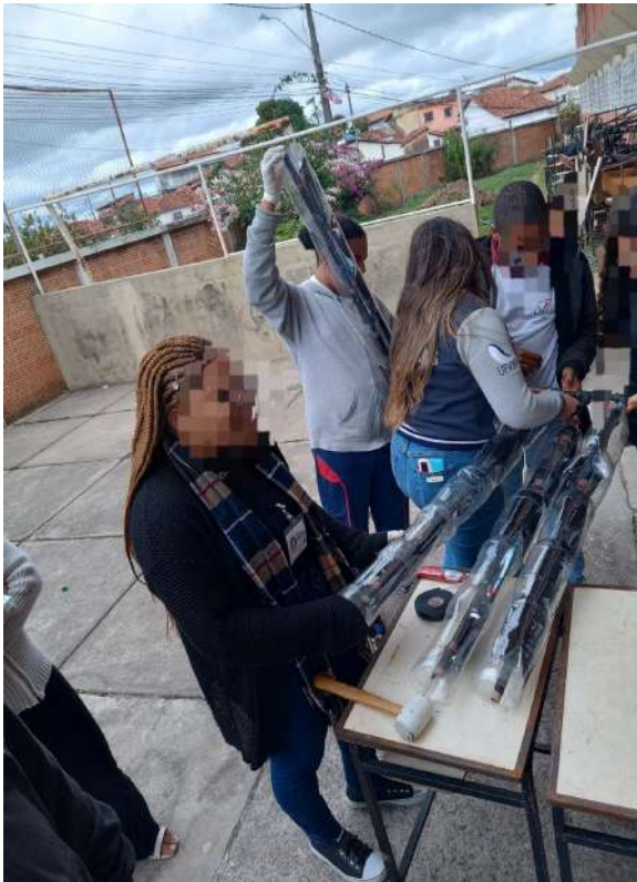
Figuras: Processo de Montagem do ASBC