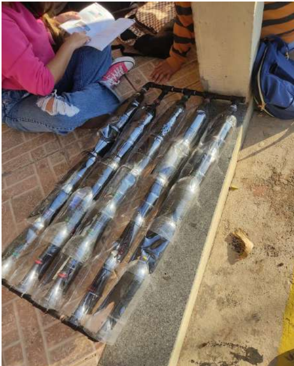
Figuras: Processo de montagem do ASBC