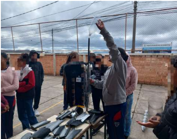
Figura: Processo de montagem do ASBC