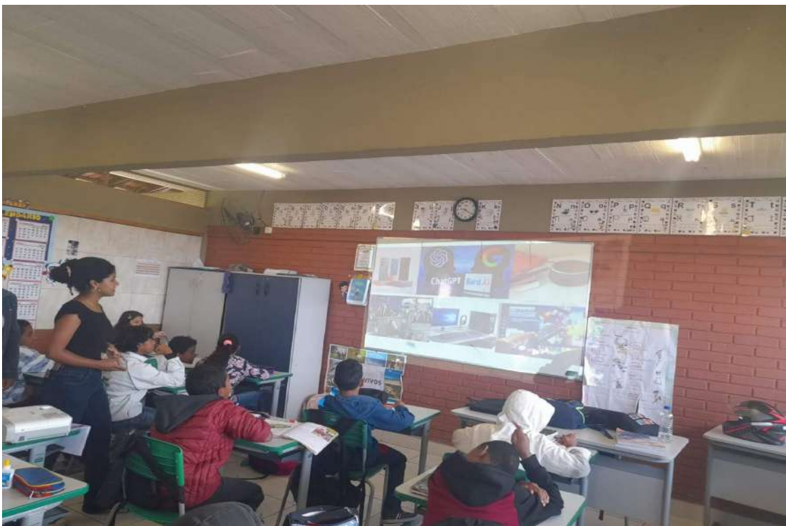
Figura: Aplicação de aula expositiva dialogada para sexto ano