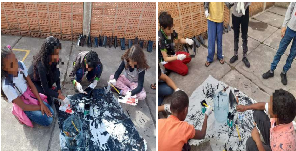
Figura: Pintura dos materiais