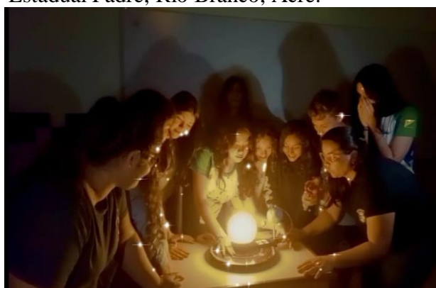
Figura 2, Uso do planetário nas aulas de Geografiado ensino fundamental, Escola Estadual Padre, Rio Branco, Acre.

Na-Figura 2, pudemos observar momentos de interação com o uso do planetário, onde os estudantes observaram e interagiram para aprender sobre os movimentos de translação, rotação, eclipse lunar e eclipse solar.