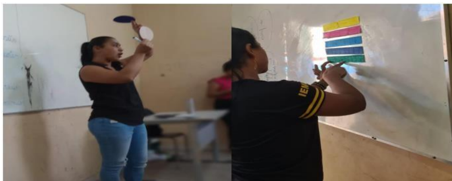
Imagem 3 – Explicação dos discos e régua de fração