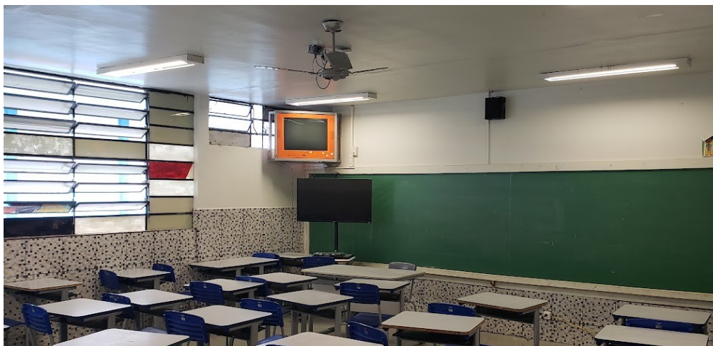
Figura 3. Sala de aula equipada com o sistema “Educatron”

Durante muitas das visitas foi visto na tela propagandas de cursos técnicos focados no agronegócio, ou de games inseridos na educação, mas em momento algum os estudantes demonstraram interesse na imagem na tela, como outdoors em rodovia, desvia o foco, polui a imagem e não tem mais tanto alcance como peça publicitária que tinham em outros momentos, mas, com certeza acendeu um alerta sobre que tipo de informação é colocada nos papéis de parede e descansos de tela.