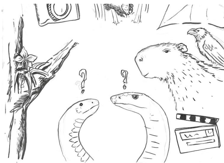
Imagem 3 - Projeto Filmes e Relações Ecológicas