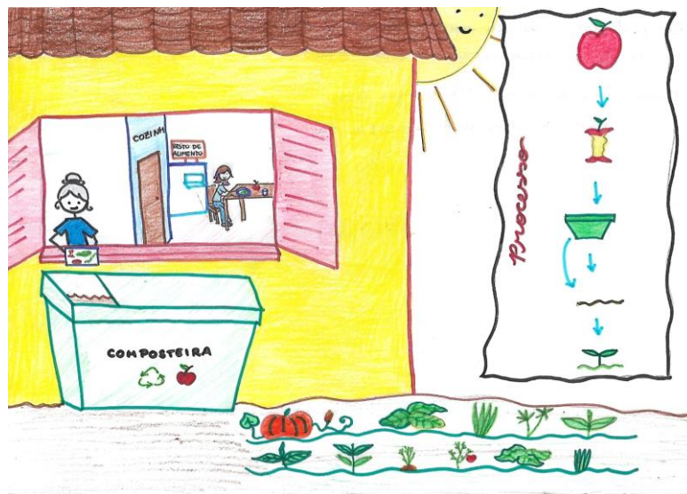
Imagem 1 - Projeto Compostagem