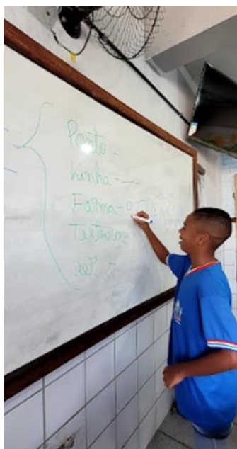
Imagem – 1: “Espetáculo da aprendizagem”, segunda semana de aula – Aluno compartilhando com a turma seus conhecimentos, Salvador, BA, abril, 2023.

Ao longo desse percurso, compreendemos o espaço cênico não apenas como o palco tradicional, mas também como um espaço presente em diferentes contextos, como em casa, na escola ou mesmo quando o aluno assume o protagonismo ao conduzir uma atividade. Para tanto, foi valorizada a possibilidade de observação e auto-observação, formação de discurso e argumento, participação e observação participante dos mais tímidos, em uma espécie de dança entre o conhecer, o fazer e o apreciar através das artes visuais em contato com a estética do oprimido, permitindo que os estudantes atuassem tanto como atores quanto como espectadores no "espetáculo da aprendizagem" uns dos outros, conforme podemos ver na imagem – 1.