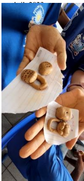
Imagem – 4: “A Bolsa”, quarta semana de aula – Objeto em argila produzido por estudantes. Salvador, BA, abril, 2023.