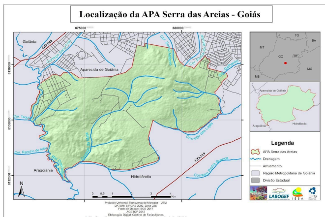
Figura 01: Localização da APA.