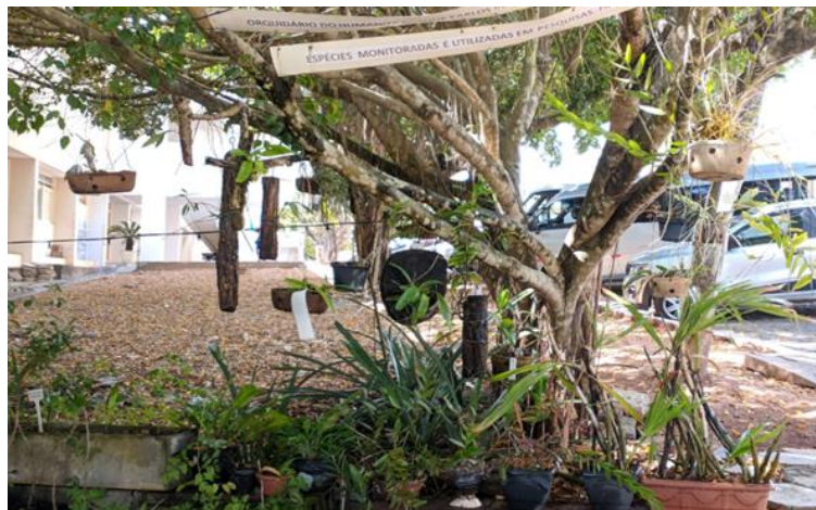
Figura 1: Área de concentração do orquidário do HBCB/CH/UEPB, 2023.

O orquidário do HBCB/CH/UEPB está embaixo de uma árvore perenifólia de Ficus benjamina L., pertencente à família Moraceae , tem uma área de 12m 2 , e fica em um local aberto de fácil acesso onde conta com 12 espécies de orquídeas, parte delas ficam dispostas sobre os galhos da árvore, representando a forma que se comportam da natureza (Figura 01). Uma parte das orquídeas são cultivadas em vasos com substrato (rupícolas) e a outra fração estão dispostas em toras de madeiras (epífitas), todas as espécies são nativas do Brasil.