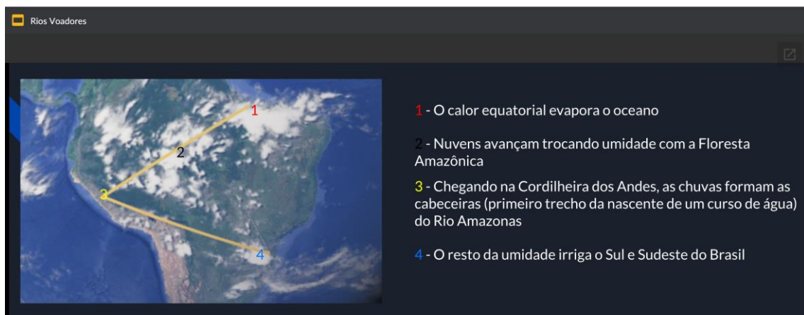
Figura 2 – Slide realizado pelo aluno João Pedro (8º ano)