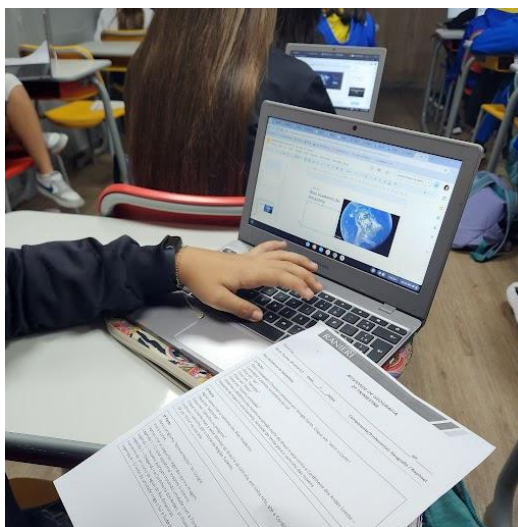
Figura 1 – Etapa III da Atividade.

A etapa III serviu como conclusão da atividade (Tabela 2). Após a elaboração das imagens, cada aluno criou uma série de slides no Google Apresentações que continham legendas, pesquisadas previamente, de cada etapa do fenômeno climático abordado (Figuras 1 e 2).