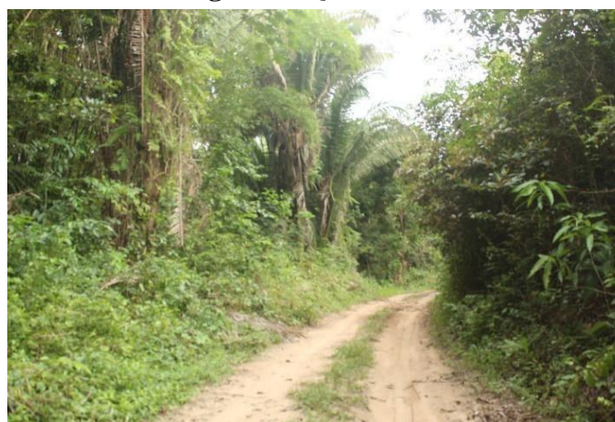
Figura 3: Quinto Ponto coletado

Abaixo temos os pontos 5 e 2 que obtiveram maiores diferenças nos resultados da análise de matéria orgânica.