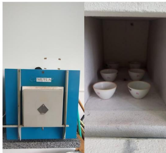
Figura 1: Análise de teor de matéria orgânica

O método da mufla consiste na determinação gravimétrica do \text{CO}_2 evoluído e na perda de massa de resíduo submetido à alta temperatura por certo intervalo de tempo; na determinação da MO, considera-se, assim, a diferença de peso inicial (amostras secas a 105\text{ }^\circ\text{C} ) e de peso computado após a incineração da amostra a 550\text{-}600\text{ }^\circ\text{C} . Os equipamentos utilizados para o desenvolvimento da análise, foram a mufla e os cadinhos.