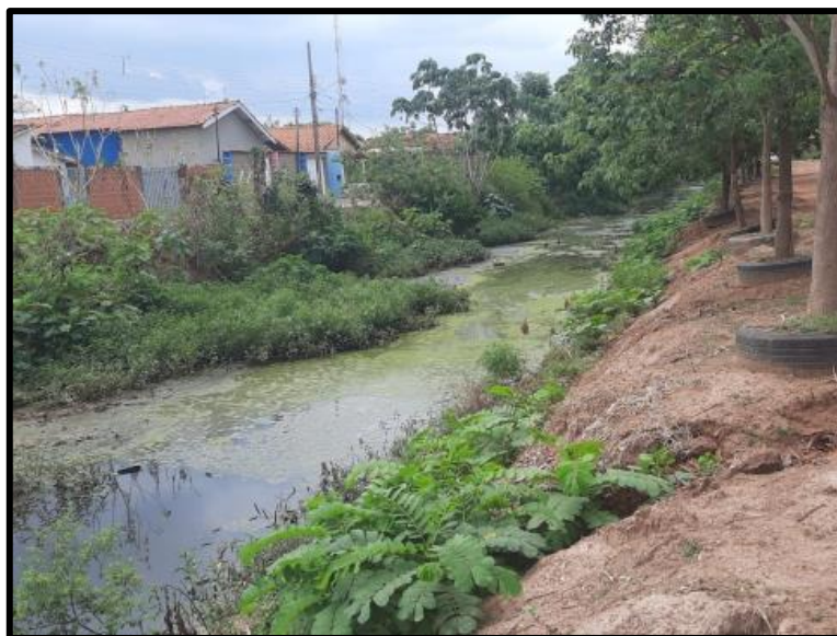
Figura 3. Margem urbanizada do córrego Sangradouro

As margens não possuem vegetação, não respeitando a legislação da Lei nº 12.651 de 25 de maio de 2012 na delimitação das Áreas de Preservação Permanente - APP, considerando a largura do rio para manter 30 m de a área preservada (Brasil, 2012). Ressalta que as construções civis estão próximo as margens, contribuindo com os processos erosivos. E que em alguns casos, a defesa civil terá que remanejar algumas famílias dessa localidade (Figura 3).