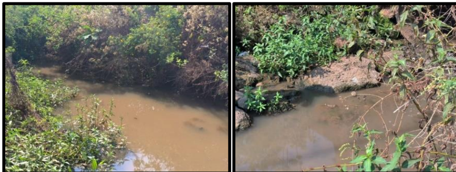
Figura 4. Córrego Sangradouro na parte central, em Cáceres-MT

A terceira seção está localizada entre as coordenadas geográficas 16° 04' 24.9" latitude Sul e 57° 40' 50.9" longitude Oeste na área central da cidade de Cáceres. No local foi registrado ponte com manilhamento para a passagem da avenida Sete de Setembro aos bairros próximos, com a presença dos comércios e órgãos municipais e federais. Foi observado o uso e ocupação das margens, com destaque o solo exposto em ambos os lados e processos erosivos atuantes (Figura 3).