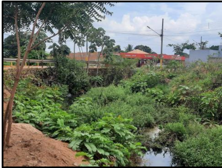
Figura 2. Ponte de concreto do córrego Sangradouro