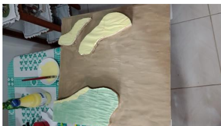
Figura 3 - Maquete utilizada em sala de aula como recurso didático do tema planícies aluviais e bacia sedimentares

Apesar do empenho de professores em ofertar o ensino adequado aos alunos, problemas estruturais tornam desafiador o processo de ensino-aprendizagem nesta escola, pois a falta de infraestrutura adequada impossibilita que alguns assuntos da disciplina de geografia sejam abordados de forma que cativa o aluno a aprender. Utilizou-se o uso de projetor de imagens para ilustrar aos alunos como a geomorfologia da região onde estes residem funciona, e também a maquete de geomorfologia (Figura 3), assim foi explicado a eles todos os motivos os quais acontecem os alagamentos, inundações e erosão que afetam a escola de maneira rigorosa durante o período chuvoso e de maré alta na região metropolitana de Belém (Figura 4).