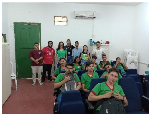
Figura 1 - Dia da apresentação em sala de aula com alunos