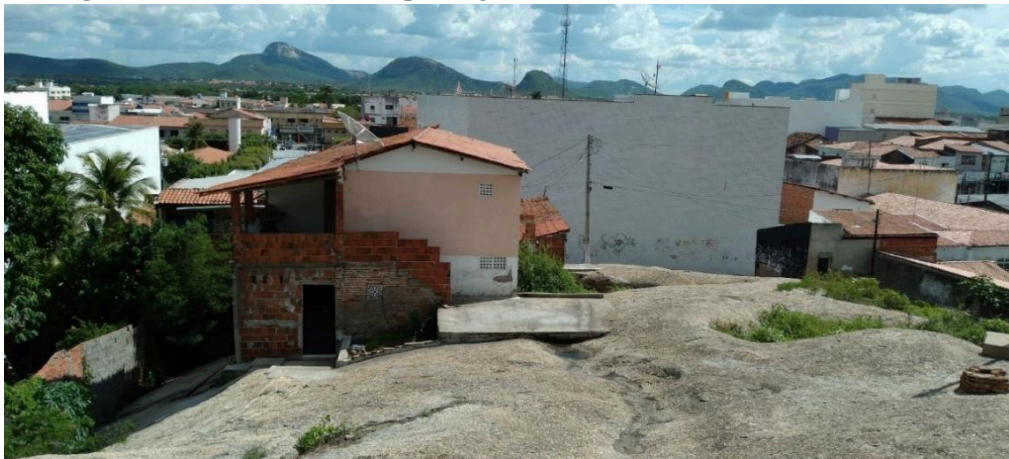
Figura 3 – Construções no sopé do geossítio Pedra do Cruzeiro, Quixadá-CE