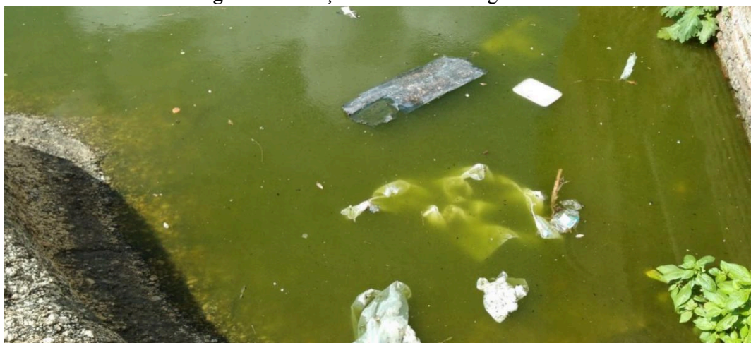
Figura 5 - Poluição identificada no geossítio.